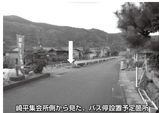
崎平集会所側から見た、バス停設置予定箇所

崎平地区のバス停「崎平集会所」を大井川鉄道崎平駅前付近に移設します。新しいバス停の名称は「崎平駅前」です。