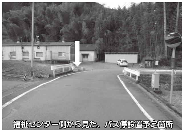
福祉センター側から見た、バス停設置予定箇所

上岸地区にある福祉センターの近く(前山地区)に、新たに「福祉センター前」というバス停を設置します。