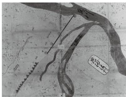
毘沙吐村絵図(元禄15年)

江戸時代の毘沙吐村は、幕府の直轄領で、60軒程の家があつて、村内に三国道の渡船場や藤ノ木河岸があつたんだ。そこで、神流川・烏川を利用して舟で貨物を運んだり交通したりする舟運や漁業が盛んで、毎年鮎1200匹・鮭42本を献上していたんだよ。