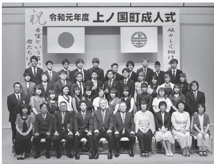
仲間や恩師たちと思い出の1枚

終了後には、有志により祝賀交流会が催され、久しぶりに再会した恩師や旧友と語り合うなど、話に花が咲いていました。