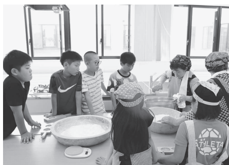
熟練の技をしっかりと学びます。