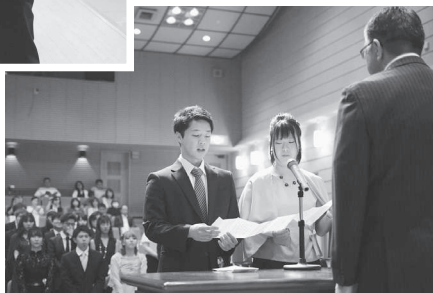
誓いの言葉を述べる二人