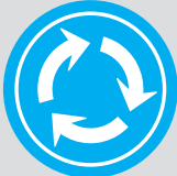
環状交差点標識 (ラウンドアバウト)

ラウンドアバウトは円形の平面交差点で環道内において車両が時計回りに通行しかつ、進入する車両によりその通行を妨げられない交通が確保できる交差点です。