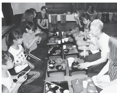
みんなでおしくいただきました！