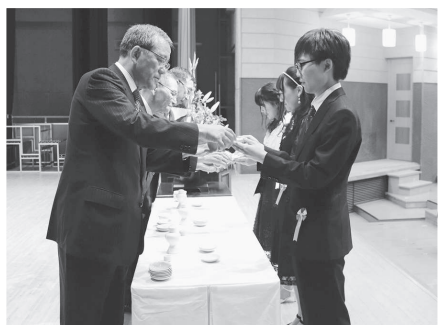
祝酒献杯！ 成人おめでとう！