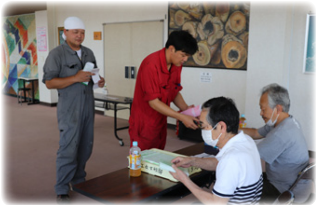
プレミアム商品券第2弾発売の様子