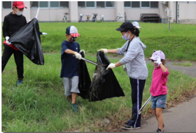
ごみ拾いする参加者

海岸のごみを拾った参加者は「たばこの吸い殻など海で遊ぶには危険なごみがたくさん落ちていた。また機会があれば参加したい」と話していました。