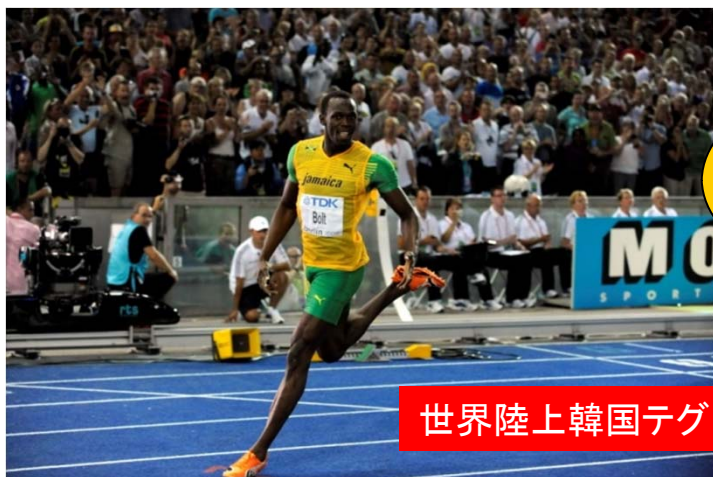
世界陸上韓国テグ