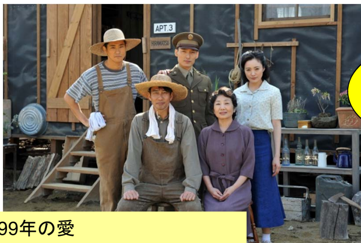
99年の愛 ~JAPANESE AMERICANS~