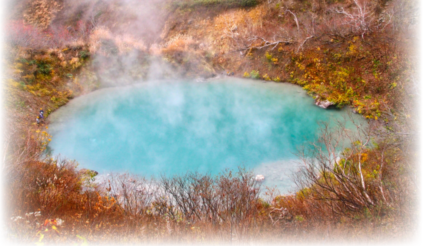
青白い湖面から湯気をあげる新湯