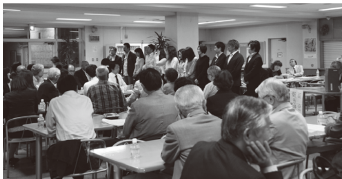
代議員会で紹介される本年度の総会実行委員会(高校34回)。

また、林学園理事長より、4年後の創立90周年事業の一環として、中学校舎(旧女子部)と図書館棟を建て替える予定であることが報告され、その節は募金などできる範囲でご協力いただきたいとご挨拶がありました。