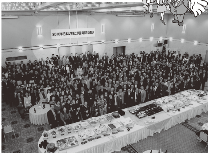
平成22年の総会(同窓生の集いの)の記念撮影風景。アルカディア市ヶ谷にて。