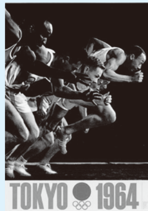
亀倉雄策「東京オリンピック」1962年。国立近代美術館所蔵。第18回オリンピック競技大会(1964/東京)の第2号ポスター。いまでも新鮮で躍動感あふれるものだ。

1964年東京オリンピックの公式ポスターを制作し脚光を浴びる。1972年札幌オリンピックポスターも手がける。わが国のグラフィックデザイナーの草分け的存在として、多くの企業のロゴマーク制作にも携わった。紫綬褒章を受章し、文化功労賞にも選出されるなどの業績を残した。平成9年没(82歳)。