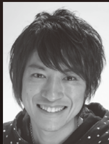
木越優 (岸田太郎役/タレント)