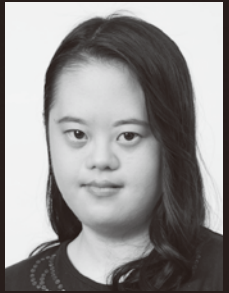
神子彩 (山下こころ役)