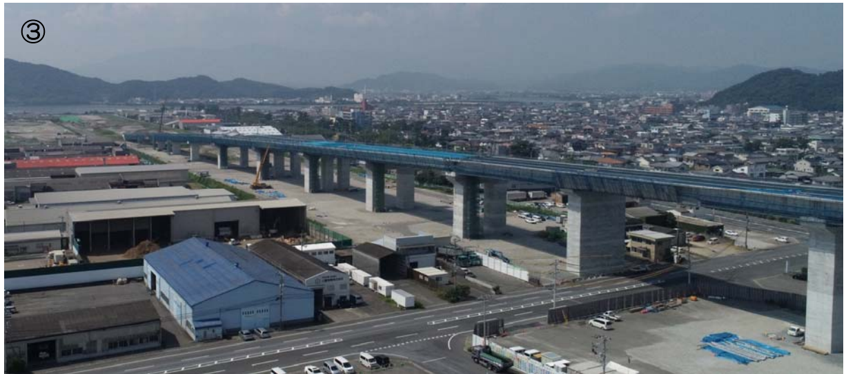
徳島津田 I C 付近