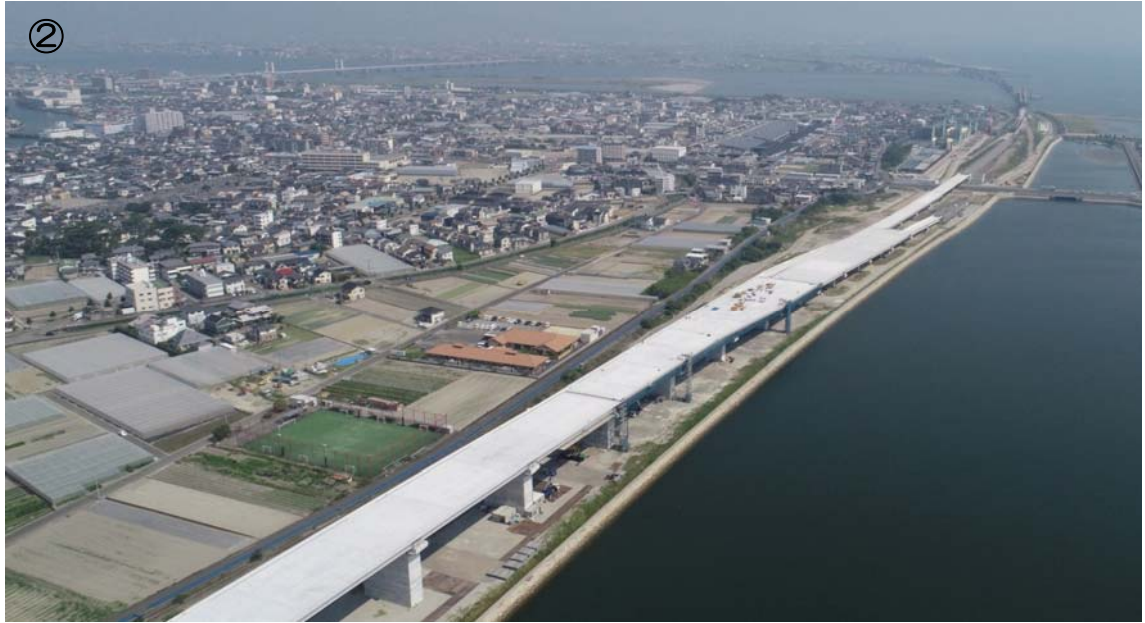
徳島沖洲 I C 付近