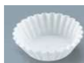
(クッキングシートなど)