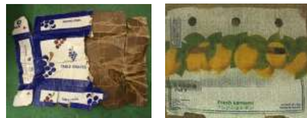
(輸入青果物・水産加工品を入れる段ボール箱)