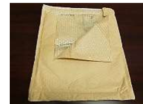
(通販用緩衝封筒など)