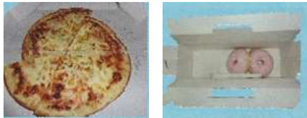
(ピザ、ケーキなどの食品を直接包装した容器)