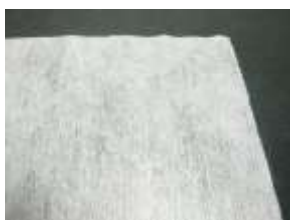
(マスク、簡易お手拭、包装紙など)