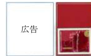
(サンプルが付いたままの 新聞折込チラシ、雑誌)