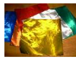
(金銀の折り紙など)