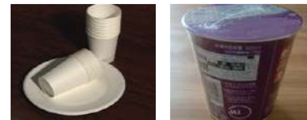
(紙コップ、紙皿、紙製のカップ麺容器など)

B 類の「古紙に混入することは好ましくないもの」の中には、製紙原料などとして利用できるようになってきているものがありますので、地域の古紙問屋又は古紙回収業者にご確認ください。