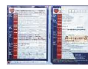
(公共料金の請求書)