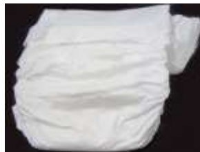
(紙おむつ、生理用品、ペット用トイレシート)