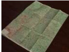
(地図、選挙ポスター)