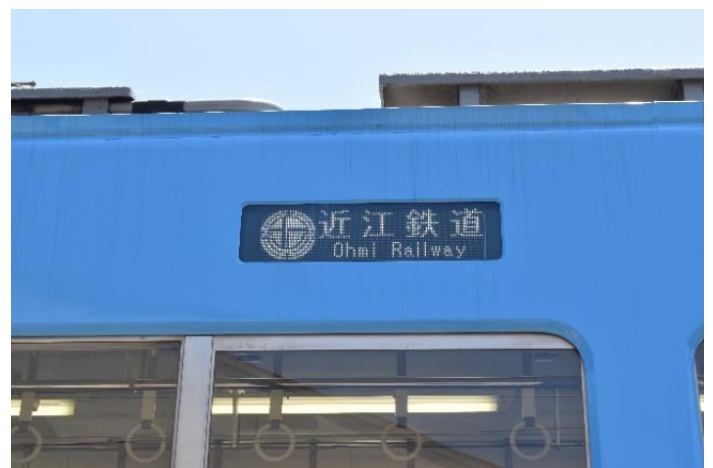
白色 LED を採用した行先表示器

近江鉄道公式 You Tube チャンネルでは、新形式車両 300 形の改造工事に携わった担当者にインタビューし、300 形導入の背景や魅力に迫る動画を公開しています。