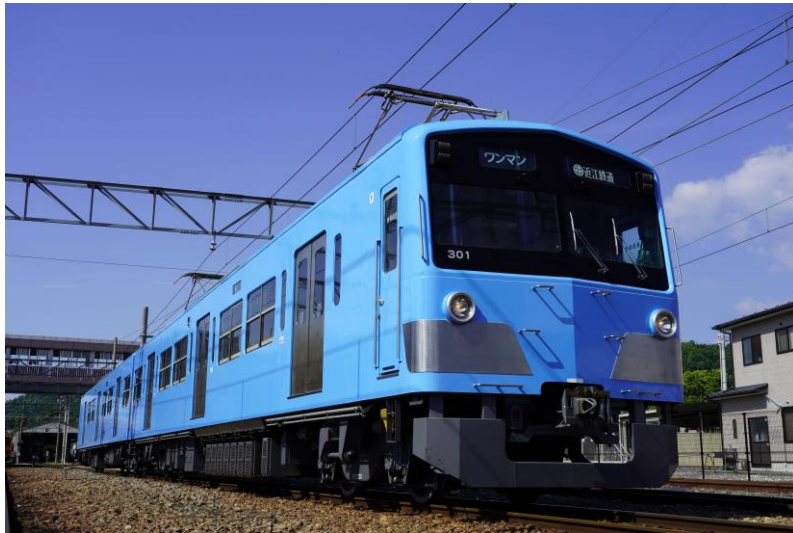
近江鉄道新形式車両 300 形 301 号・1301 号 (2 両 1 編成)

西武鉄道より譲り受けた 3000 系を自社でワンマン改造した車両で、近江鉄道では初となる乗降扉上に車内案内表示器を設置し、行先や次駅案内を表示することで利便性向上とバリアフリーへの対応を図りました。車両前面と側面の行先表示器は白色 LED を採用し、はっきりと視認しやすくなっています。車体のカラーは、100 形と同様に琵琶湖をイメージした水色（オリエントブルー）を採用しました。