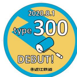
記念ヘッドマーク