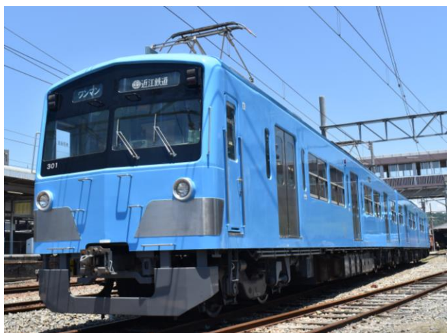
8月1日にデビューする近江鉄道300形