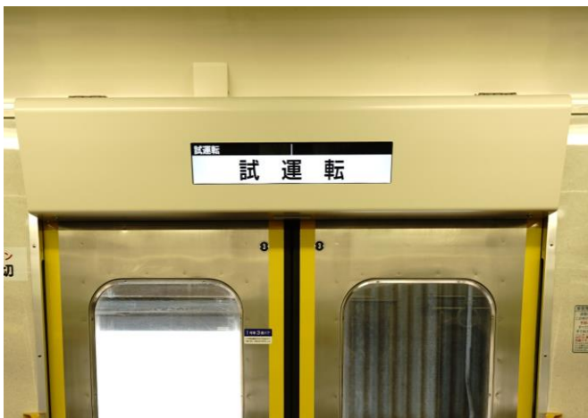
車内案内表示器（乗降扉上、各車両 3 ヶ所に設置）