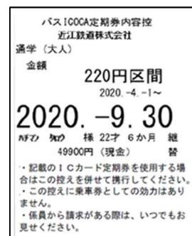
<バス ICOCA 定期券内容控>