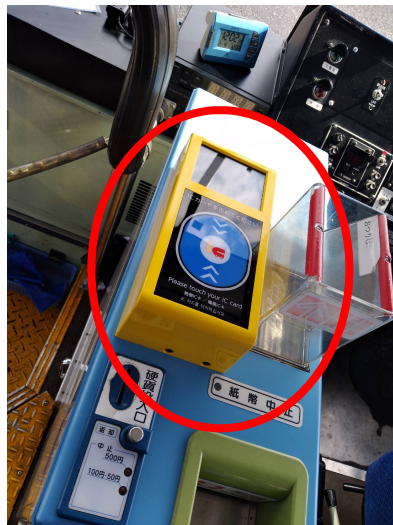
〈降車時のICカードリーダー〉