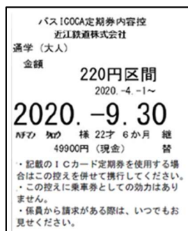
<バス ICOCA 定期券内容控>