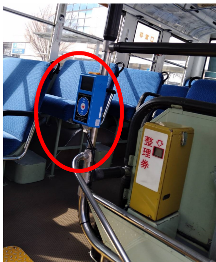
〈乗車時のICカードリーダー〉

降車時は、運転席横の運賃箱に設置されている黄色のICカードリーダーにICOCAをタッチすると自動でご乗車区間の運賃がチャージ残高から引き去られます。