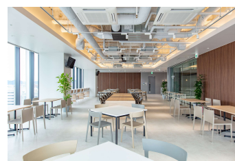
リフレッシュゾーン