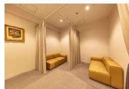
リチャージゾーン

外部交流ゾーン「KURUN HALL」は、地域とつながるホールとして104席の移動観覧席を設置し、来年度より外部貸出を予定していますが、緊急事態への備えとしてBCP拠点の役割も担います。万が一に備えた設計・設備により、放送局の社会的責任を果たしていきます。