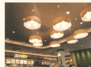
店内はLED照明を使用

さらにサブウェイのもう一つの特徴に、YOUR WAY (自分の好みを注文) があります。「4種類のパンの中から好きなものを選んで、あとはトッピング (有料) をしていただいて、嫌いな野菜はもちろん抜けますが、増やしたいものは無料で増やしていただいて、ドレッシングもお好みを選んでいただいて、本当にオーダーメイドのサンドイッチになります。パンもゴマが使われていたり、日本だけですがハチミツの粉がまぶされているものもあります」と浦川さん。肥満率が高くなっていく沖縄だけに、サブウェイの低カロリーで健康志向のサンドイッチは見逃せないところですよ。