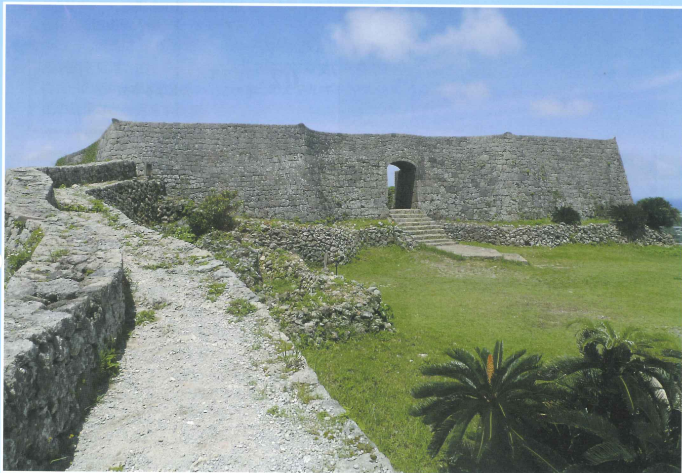
世界遺産・国の史跡 中城城跡(北中城村・中城村)