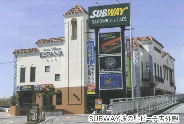
SUBWAY波の上ビーチ店外観