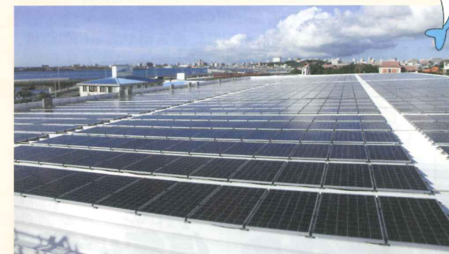
サラダボウル屋上の太陽光・多結晶パワフルモジュール

全国の屋根上メガソーラーランキング (『solvisto』2013.5) によると、沖縄県ではJAおきな関連施設23箇所に次ぐ規模で、全国でも65番目とな