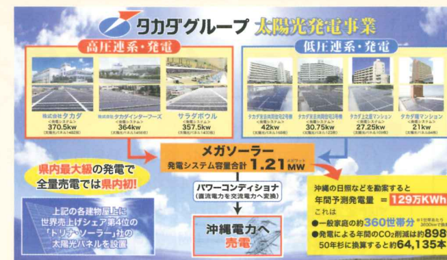
タカダグループの太陽光発電事業

っています。年間の二酸化炭素削減量は約900t、これは50年杉の木に換算すると約64,000本にあたるそうです。