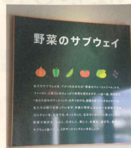
日本独自の「野菜のサブウェイ」

健康志向の「サブウェイ」を運営する株式会社タカダ (タカダグループ) では、再生可能な自然エネルギーの普及・拡大を目指して、グループ全体で太陽光発電事業にも取り組