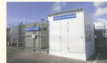
太陽光発電 直流・交流変換装置と太陽光発電システム高圧変電装置

全国の屋根上メガソーラーランキング (『solvisto』2013.5) によると、沖縄県ではJAおきな関連施設23箇所に次ぐ規模で、全国でも65番目とな