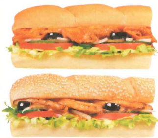
期間限定メニューの牛肉ブルコギ(上)と豚カルビ(下)

株式会社タカダ・カルチャー事業部では、日本人向けとなったサブウェイを沖縄に定着させたいとフランチャイズに加盟し、2012年の10月に「TSUTAYA (ツタヤ) 那覇新都心店」の中に1店舗目をオープン。次いで「TSUTAYA 小禄店」、「TSUTAYA 首里店」にそれぞれ2店舗目、3店舗目をオープン。さらに、2013年3月18日に4店舗目として「SUBWAY 波の上ビーチ店」(以下、波の上ビーチ店) をオープンしました。「波の上ビーチ店」は国内では430店舗目にあたるそうです。