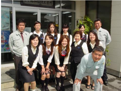
皆様のお越しをお待ちしています。