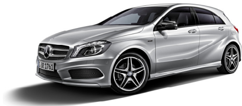
A 180 BlueEFFICIENCY Sports EDITION NEXT