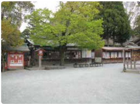
境内のたたすまい

尚、この（仮称）「平成の大修理」の概要計画や途中報告は随時、また「社報たまたれ」バックナンバーにつきましても、高良大社公式ホームページで御覧戴けますので是非御利用下さい。