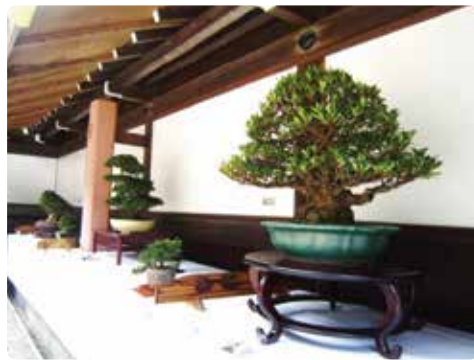
さつき盆栽秋季展

◆十月九日(木)～十日(土) 第十五回 嵯峨御流生け花展 華道嵯峨御流諸岡社中 中門内展示場