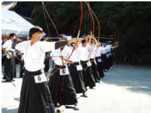
福岡県及び近県より参加の老若男女による熱戦が繰り広げられます

◆十月十三日(月) 体育の日 第四十四回 高良山弓道大会 百々手式 境内特設会場