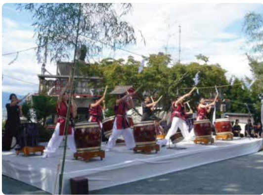
筑水高校太鼓同好会

◆九月二十六日(金)～二十八日(日) 第十五回 さつき盆栽秋季展 さつき盆栽趣味の会 中門内展示場