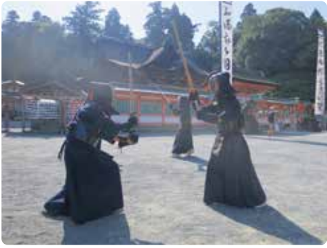
小学生から高校生の剣士達が日頃の鍛練の成果を発揮し熱戦を繰り広げます