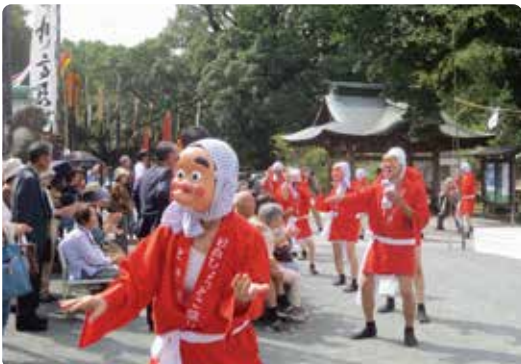
日向ひよつとこ踊り

◆十月十二日(日) 午前十時より 境内特設舞台 古武道棒術 神影流心気道棒術 獅子舞・風流 高良山同志会 御井町風流保存会 民謡奉納 日本民謡協会大川支部 空手奉納演武 新極真会佐賀筑後支部 久留米道場 和太鼓奉納 筑水高校太鼓同好会 鼓舞 御井鼓舞