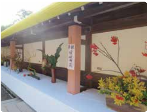
嵯峨御流生け花展

◆十月九日(木)～十日(土) 第十五回 嵯峨御流生け花展 華道嵯峨御流諸岡社中 中門内展示場