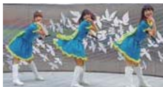
▲今後も五月山動物園公式 PR アイドルユニットとして、ウォンバットたちの魅力を発信していきます