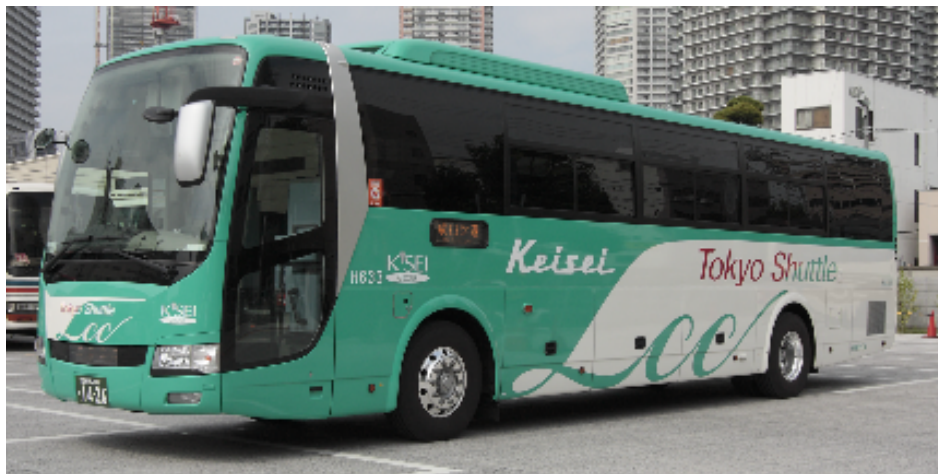
『東京シャトル (Tokyo Shuttle)』の運行車両

京成グループの京成バス（本社：東京都墨田区、社長：大室 健）、成田空港交通（本社：千葉県成田市、社長：佐藤 克己）、京成バスシステム（本社：千葉県船橋市、社長：青木 良憲）、リムジン・パッセンジャーサービス（本社：東京都中央区、代表：蓮尾 眞一）では、9月1日（日）に、高速バス『東京シャトル (Tokyo Shuttle)』のダイヤ改正に伴う増便を実施し、さらなる利便性の向上を図ります。