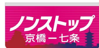
「京橋－七条間ノンストップ」表示