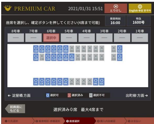
座席マップ(日本語)