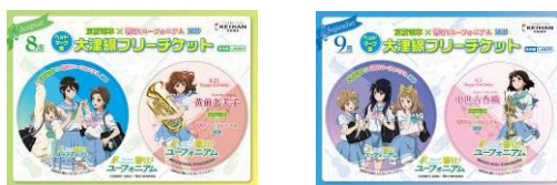
記念乗車券 (イメージ・一例)