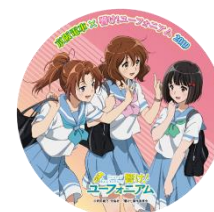
記念ヘッドマーク(イメージ・一例)