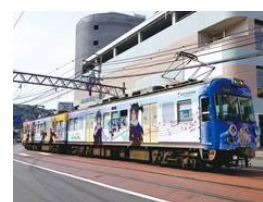
大津線ラッピング電車