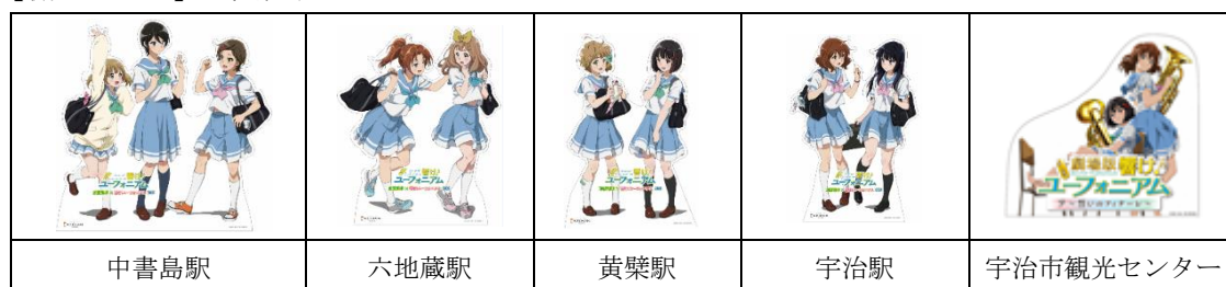
キャラクター等身大パネル(イメージ)

※展示期間中、スマートフォンアプリ「舞台めぐり」ではキャラクター等身大パネルと同デザインのマイARも登場します(京阪電車の駅設置分のみ)。プレゼント期間は駅により異なります。詳しくは、同アプリもしくは7月20日(土)に公開する京阪電車ホームページをご確認ください。