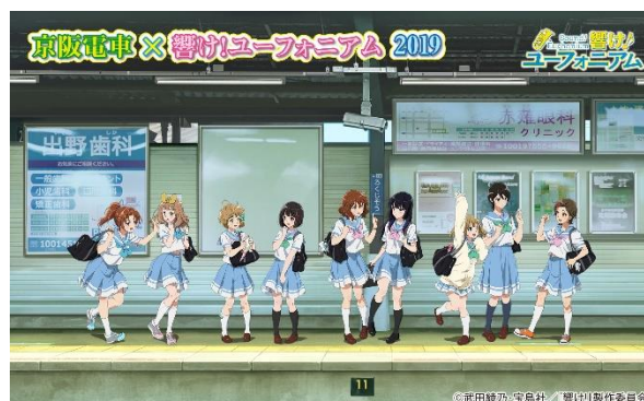
「京阪電車×響け！ユーフォニアム 2019」オリジナルイラスト

※ARキャラクターとは…スマートフォンのカメラに映した周囲の風景に、重ねて表示できるキャラクターの画像