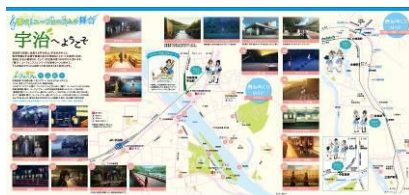
「京阪電車×響け！ユーフォニアム 2019」舞台めぐりMAP (イメージ)

作中に登場した宇治市内などのシーンをまとめた「舞台めぐりMAP」を、京阪電車の主要駅や宇治市内の各所で配布します。