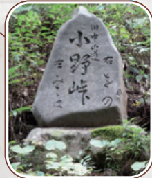
旧中山道小野峠碑