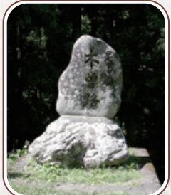
「是より南木曾路」の碑