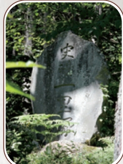
牛首峠 前山の一里塚