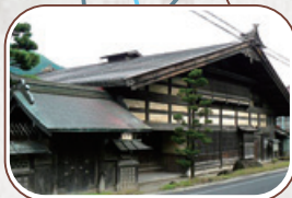
小野宿問屋(旧小野家住宅)