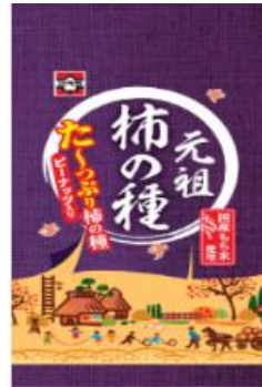
たっぷり元祖柿の種 “Kaki-Pi” Mix of Peanuts and Flavored Rice Crackers ¥250