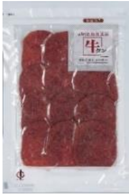
牛タンジャーキー Beef Tongue Jerky ¥1,200