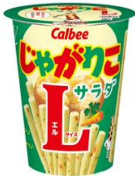
じゃがりこ L (サラダ味) "Jagariko" Potato Sticks ¥200