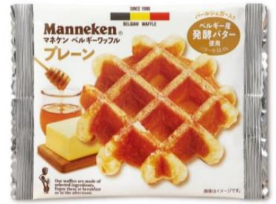
プレーンワッフル waffle (plain) ¥200