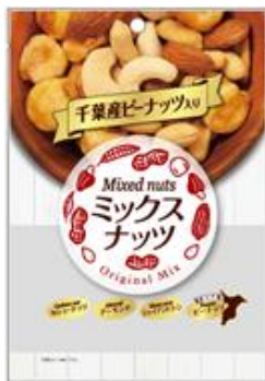
千葉県ピーナッツ入り ミックスナッツ Mixed Nuts ¥370