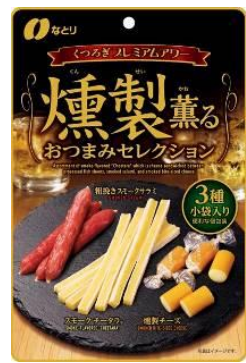
燻製薫る おつまみセクション Assortment of smoke-flavored ¥500