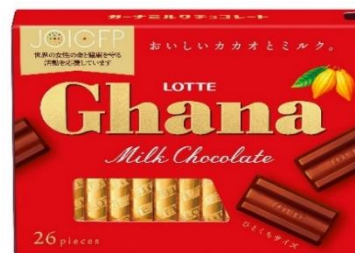
ガーナミルクエクセレント GHANA MILK EXCELLENT ¥320