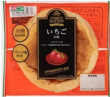
いちご小町 STRAWBERRY BUN ¥210