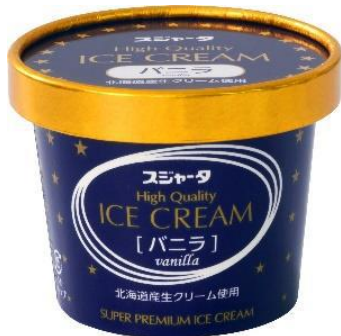
プレミアムアイスクリーム (バニラ)