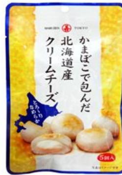
かまぼこで包んだ 北海道産クリームチーズ Cream cheese wrapped in steam fish paste ¥320