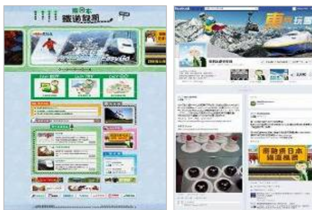
【ポータルサイト、Facebook イメージ】