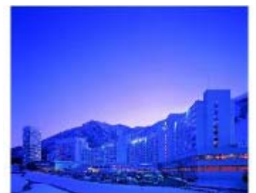
苗場プリンスホテル

苗場や雫石などJR東日本管内で9つのスキー場を運営するプリンスホテルとタイアップし、プリンスホテル向けびゅうスキー商品をインターネットで購入いただいたお客さまの中から抽選で「プリンスホテル宿泊券」が当たります。