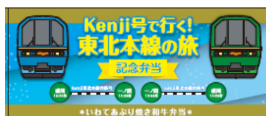
オリジナル掛け紙弁当 (イメージ)