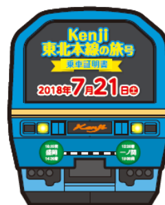
記念乗車証明書 (イメージ)