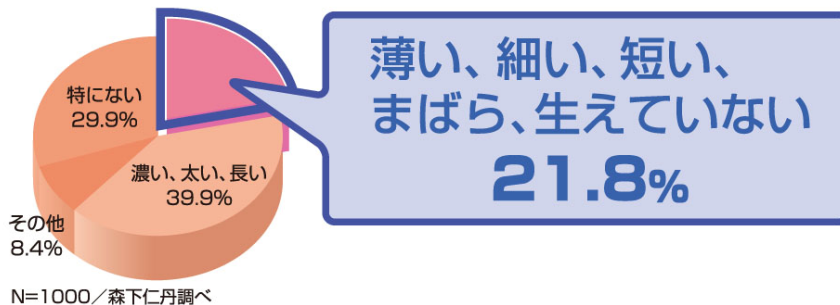
眉で最も解決したい悩み (図1)