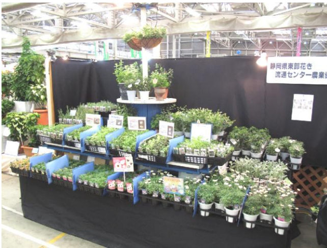
豊明花きトレードフェアにおける展示PR活動