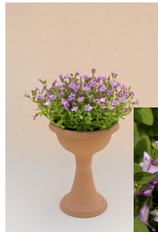
ペチュニア(ヒラタ華しぐれ) 育成者: 平田信高 ピンクリボン賞