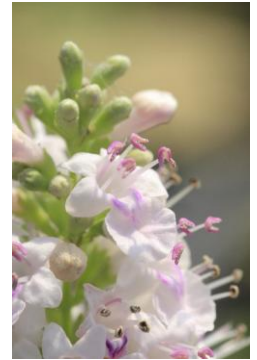
育成者: 古賀荘一 イエローリボン賞