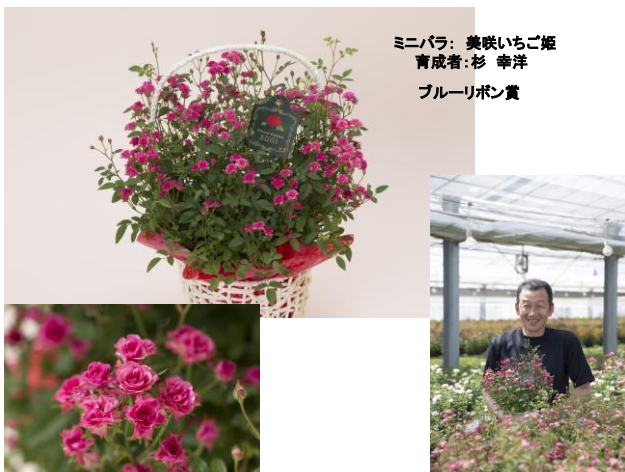
ミニバラ: 美咲いちご姫 育成者: 杉 幸洋 ブルーリボン賞