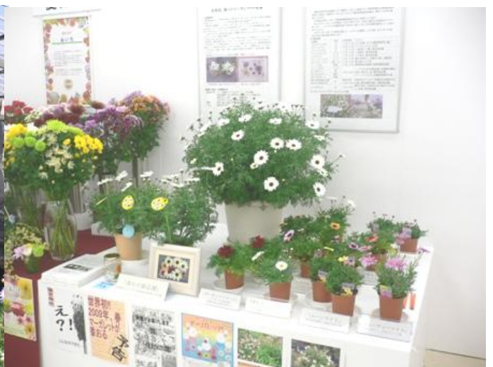
トレードファアの商品展示・紹介