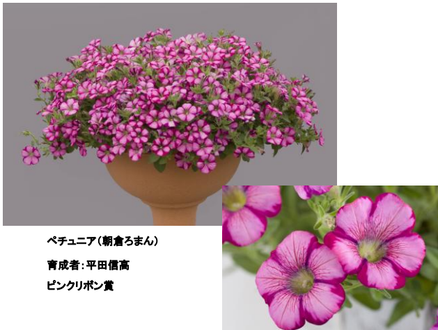
ペチュニア(朝倉ろまん) 育成者: 平田信高 ピンクリボン賞