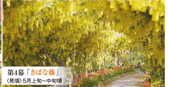
第4幕「きばな藤」 〈見頃〉5月上旬～中旬頃