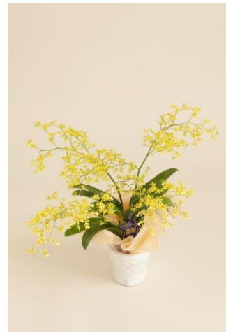
オブリダサム(ミニオブリギャラクシー)