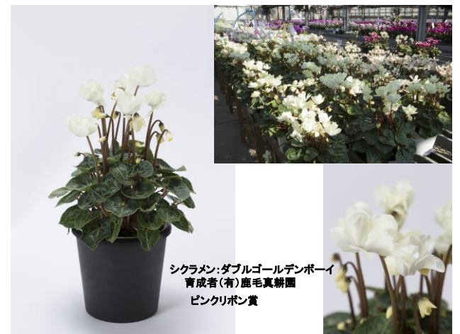
シクラメン: ダブルゴールデンボーイ 育成者(有): 鹿毛真耕園 ピンクリボン賞