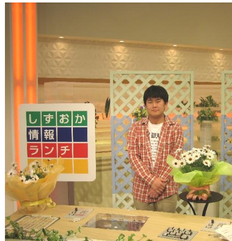
NHK情報ランチでの風恋香の紹介