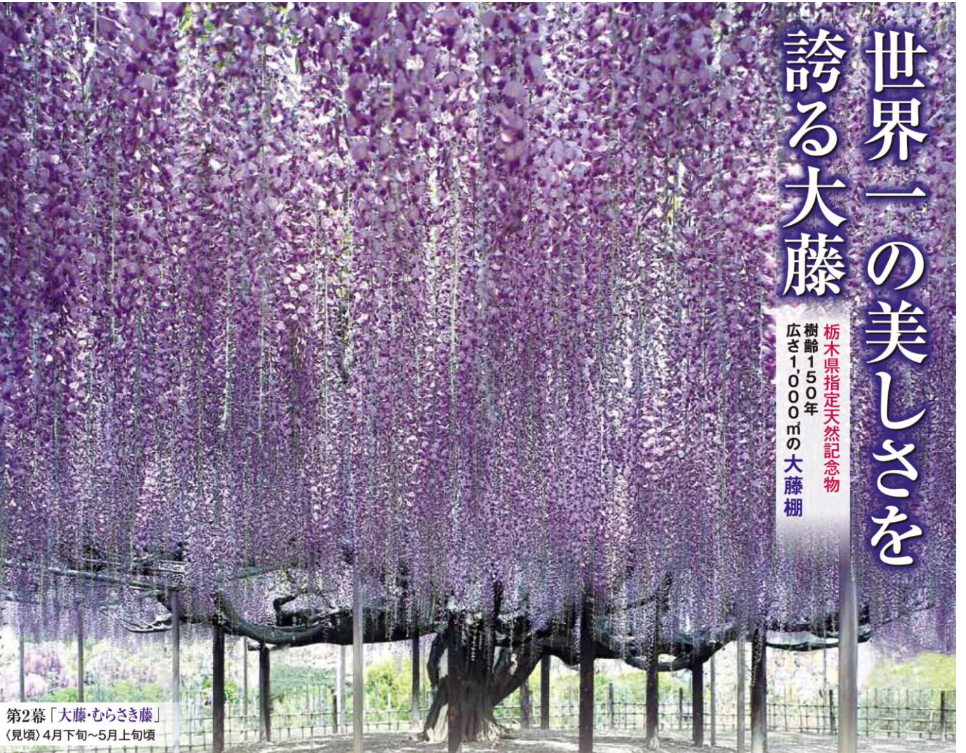
第2幕「大藤・むらさき藤」 〈見頃〉4月下旬～5月上旬頃