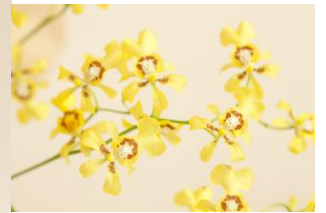
育成者: 野中茂康 ピンクリボン賞