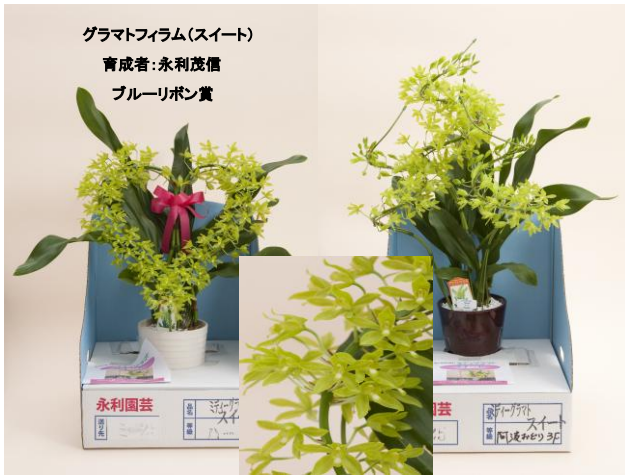
グラマトフィラム(スイート) 育成者: 永利茂信 ブルーリボン賞