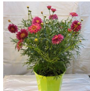
ファイアークラッカー