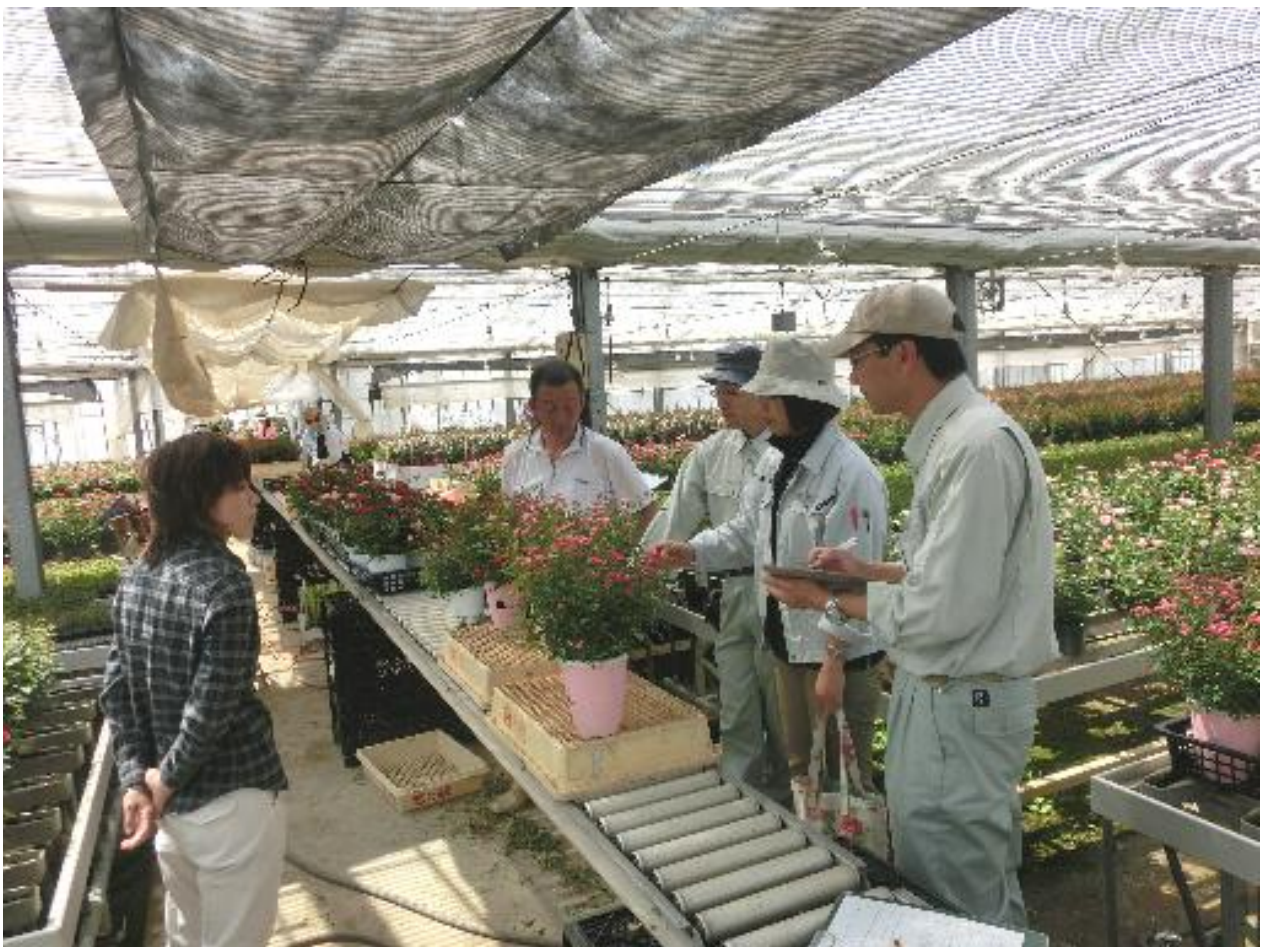
出願者の現地圃場における審査風景

これまでの受賞登録品種は、280以上に達しており、多様な花きの生産者育種を普及推進し、全国でも有力な花き産地の形成に貢献してきた。