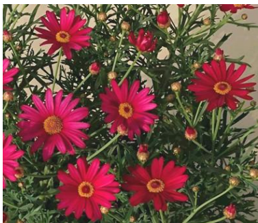
(新) プリアンルージュ