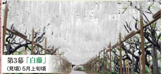
第3幕「白藤」 〈見頃〉5月上旬頃