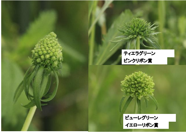
スカビオサ 育成者: 小山修一