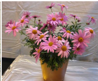
ラブリーフレンド