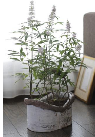
セイヨウニンジンボク(F. C. TJAPAN1号)