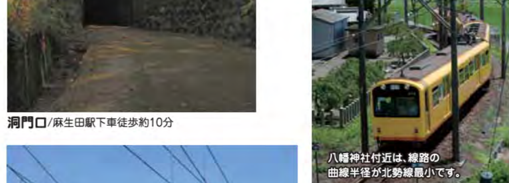
八幡神社付近は、線路の曲線半径が北勢線最小です。