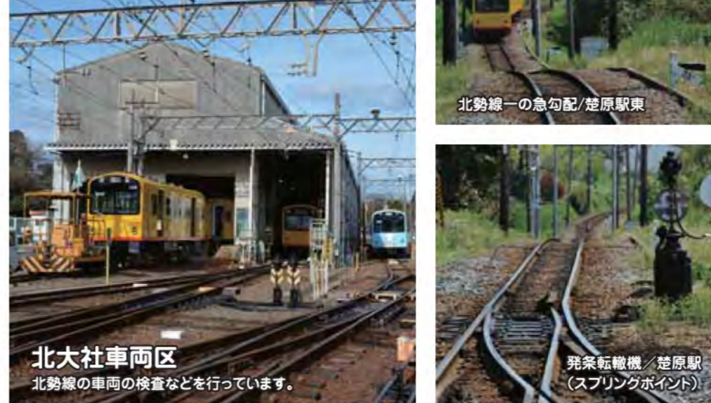
北大社車両区 北勢線の車両の検査などを行っています。

「土木学会選奨土木遺産」の「ねじり橋」と「めがね橋」 「土木学会選奨土木遺産」とは、技術水準の高さや、歴史的・文化的・地域資産としての重要性を評価された土木施設で、その選定にはまちづくりへの活用を図る目的もあります。 この二つの橋はともに大正5年に竣工されたもので、現在でも供用中の数少ないコンクリートブロックアーチ橋です。当時の高い技術が生んだ美しい曲線を持つ両橋は、「ねじり橋」「めがね橋」の愛称で今も地元の方々に親しまれています。