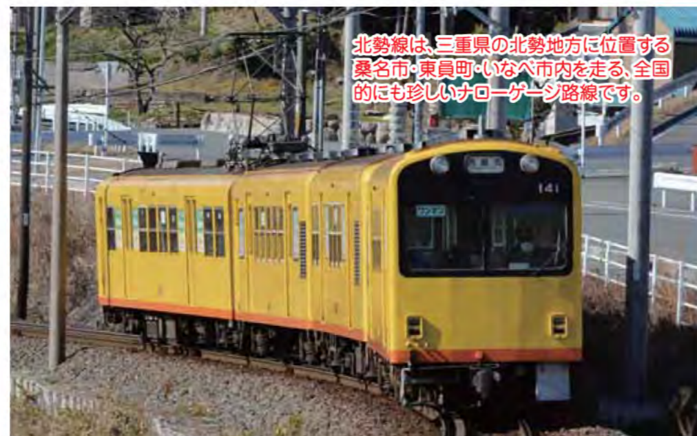
北勢線は、三重県の北勢地方に位置する桑名市・東員町・いなべ市内を走る、全国的にも珍しいナローゲージ路線です。

西桑名 馬道 西別所 蓮花寺 在良川 七星 穴太 東員 大泉 楚原 麻生田 阿下喜