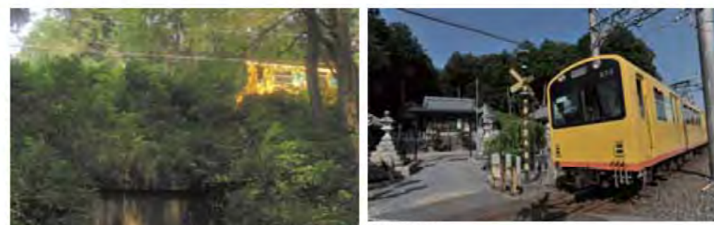
八幡神社 楚原駅下車徒歩約20分