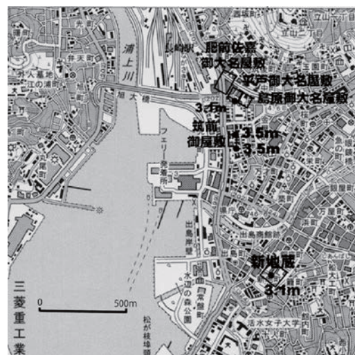
図3 長崎での津波浸水状況

諫早文庫・『日記』(S3B-557)に「肥前御蔵屋敷揚不申(あがりもうさず)、裏御門近ク迄道通潮参申候、松浦老岐守様、松平主殿頭様屋敷御門前海辺之道ニ候」の記載がある。布袋(2012)の「長崎惣町復元図」に松浦藩、平戸藩(松平主殿頭)の屋敷の海側に「海辺之道」の注記があり、津波高は3.1mとする。