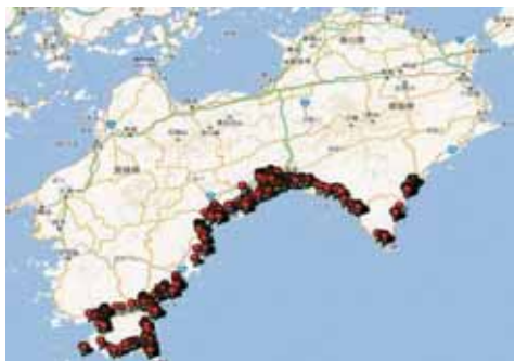
図1 現地調査位置図

「谷陵記」に宝永地震津波の被害が記録されている高知県沿岸部集落、図1の箇所を平成23年6月～平成24年6月にかけて、現地調査を行った。