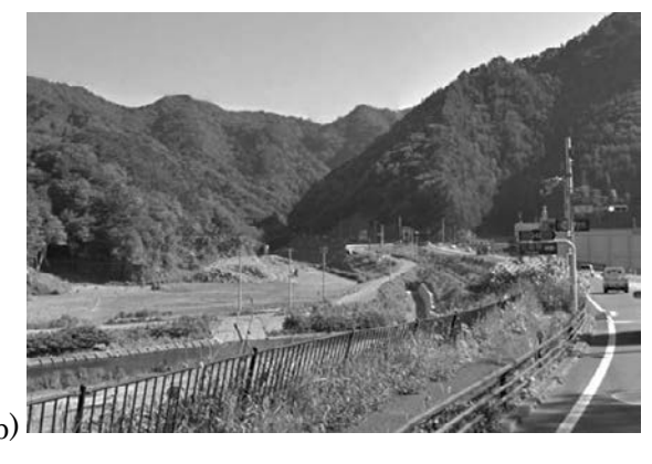
図 25a 1896 年 7 月, 東京朝日新聞付録に掲載された岩手県釜石市水海の惨状図 25b 2017 年 5 月現在の同一地点

Fig.25a The Tokyo Asahi Shimbun ran this photo of Mizuumi in Kamaishi, Iwate Prefecture, in July 1896. Fig.25b The same location as Fig.25a in May 2017.