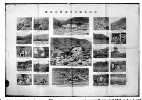
図 12 1896 年 7 月 15 日の東京朝日新聞が付録で報じた津波写真特集『三陸東海岸大海嘯被害図』 Fig.12 The Tokyo Asahi Shimbun published a special supplement of tsunami photos on July 15, 1896.

東京朝日新聞(1896)は,平板印刷機で写真印刷して7月15日に別刷り付録『大陸東海岸大海嘯被害図』として配布した[朝日新聞社(1990)]. 自社に写真師はおらず,高橋直寿,込山英松,江原竹次郎らの写真23枚で構成した(図12).