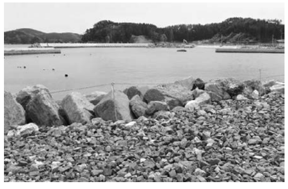
図 23a 1896 年 6 月, 込山英松が撮影した陸前高田市小友町で収容された犠牲者(雑誌『太陽』より) 図 23b 2017 年 5 月現在の同一地点

Fig.23a This photo, taken by Hidematsu Komiyama, shows the bodies of disaster victims in Otomo village in Rikuzentakata in June 1896 (Magazine Taiyo).