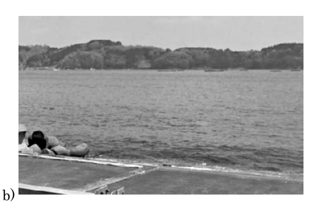
図 20a 1896 年 6 月, 国府留蔵が撮影した宮城県志津川町権現浜に対岸の細浦から漂着した民家 図 20b 2018 年 5 月現在の権現浜

Fig. 20a This photo, taken by Tomezo Kunifu, shows houses swept away from Hosoura to Gongenhama in Shizugawa, Miyagi Prefecture, in June 1896.