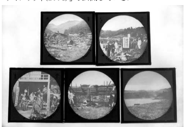
図 6 込山英松撮影写真から作られた幻灯種板(仙台市博物館蔵)

仙台市博物館には高橋直寿, 込山英松, 八戸の清雅堂の写真を基にした彩色種板が 12 枚残っている(図 6). 津波ディジタルライブラリィ[津波ディジタルライブラリィ(2004)]で公開している.