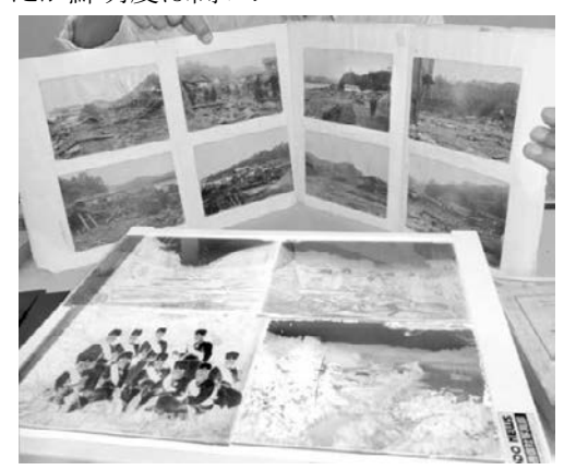
図 3 盛岡地方気象台に残った末崎仁平撮影写真の原乾板とプリント

これとは別に高橋直寿撮影の釜石・石應寺に運び 込まれた遺体群の写真のキャビネ複写乾板もあった. 複写だが鮮明度は高い.