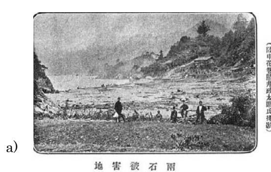
Fig.25a The Tokyo Asahi Shimbun ran this photo of Mizuumi in Kamaishi, Iwate Prefecture, in July 1896. Fig.25b The same location as Fig.25a in May 2017.

図 25a 1896 年 7 月, 東京朝日新聞付録に掲載された岩手県釜石市水海の惨状図 25b 2017 年 5 月現在の同一地点