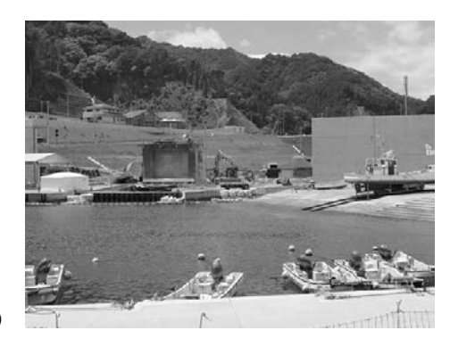
図 24a 1896 年 6 月, 高橋信三郎が撮影した岩手県釜石市両石町の惨状(宮内庁書陵部蔵) 図 24b 2018 年 6 月現在の同一地点

Fig.24a This photo, taken by Shinzaburo Takahashi, shows heavily devastated Ryoishi town in Kamaishi, Iwate Prefecture, in June 1896 (the Imperial Household Archives Collection). Fig.24b The same location as Fig.24a in June 2018.