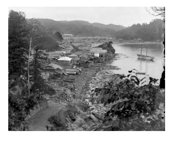
Fig.16b Hosoura fishing port was devastated by the Great East Japan Earthquake and tsunami on March 11, 2011.