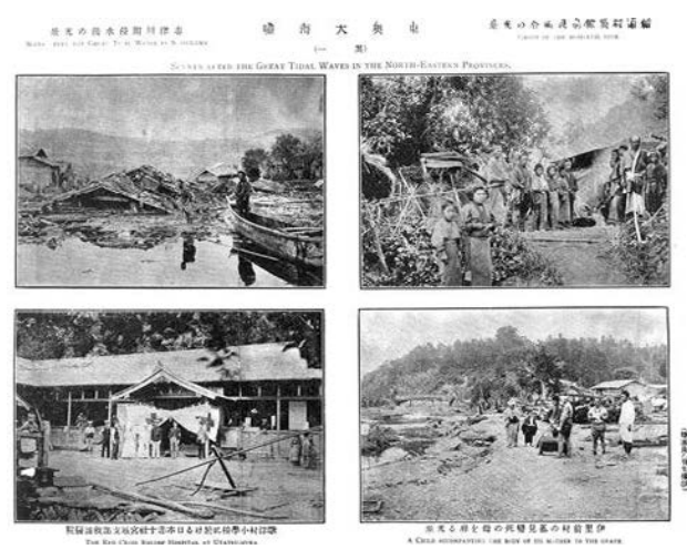
図 5 雑誌『太陽』に掲載された大橋乙羽撮影の宮城 県志津川の惨状写真

Fig.5 Photographer Otowa Ohashi's disaster photos of Shizugawa town in Miyagi Prefecture, which appeared in the magazine Taiyo.