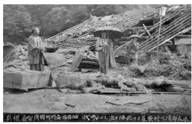
図 8 写真説明と撮影者の国府留蔵の名が付いた宮城県志津川の惨状写真(日赤豊田看護大学蔵)

写真に名前があるものは、そのまま採用した. 例えば写真の下部に名前が焼き込んであるもの(国府留蔵,図8)、裏面に名前入りの印刷物が張ってあるもの(末崎仁平,図10)、名前入りの台紙に張ったもの(江志直之進)、写真帖の表紙に名前が明記されたもの(高橋信三郎)である.