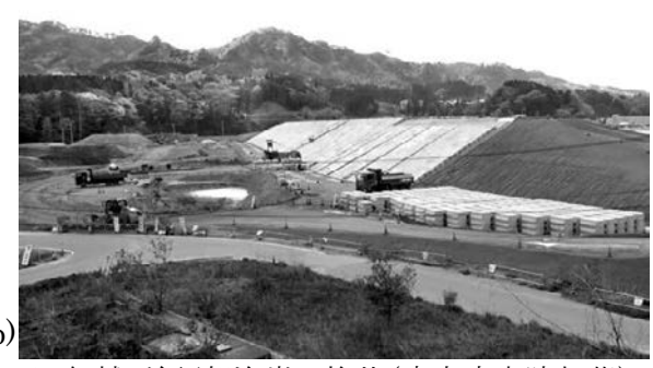
図 19a 1896 年 6 月, 高橋信三郎が撮影した岩手県山田町船越・前須賀海岸の惨状(宮内庁書陵部蔵) 図 19b 2018 年 5 月, 防潮堤建設が進む前須賀海岸

Fig.19a This photo, taken by photographer Shinzaburo Takahashi, shows Maesuka Beach in Funakoshi in Yamada town, Iwate Prefecture after the tsunami in June 1896. (the Imperial Household Archives Collection)