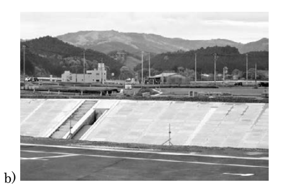
図 21a 1896 年 6 月, 国府留蔵が撮影した宮城県志津川町の新井田川付近で犠牲者を供養する僧侶図 21b 2018 年 5 月現在の同一地点. 左後方の建物は東日本大震災で住民 327 人が屋上に避難して助かった高野会館

Fig.21a This photo, taken by Tomezo Kunifu, shows monks praying for victims of the earthquake and tsunami near Niidagawa River in Shizugawa town, Miyagi Prefecture, in June 1896.