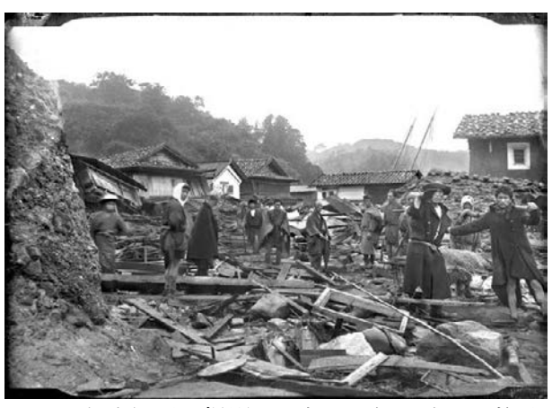
図 9 末崎仁平が撮影した岩手県鍬ケ崎町の惨状 (岩手県立博物館蔵)

Fig.8 A photo of devastated Shizugawa town in Miyagi Prefecture taken by photographer Tomezo Kunifu. An explanation and Kunifu's name were printed at the bottom of the photo. (Collection of the Japan Red Cross Toyota College of Nursing)