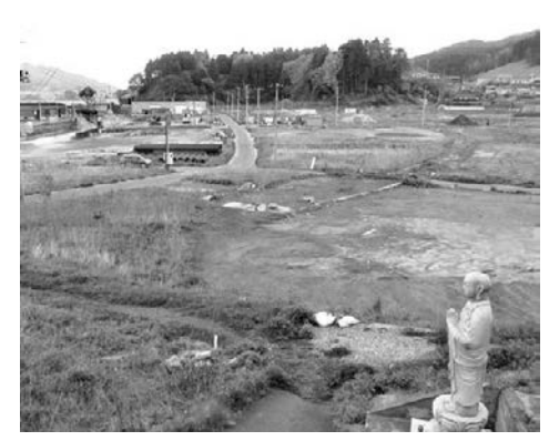
図 18a 1896 年 6 月, 高橋信三郎が撮影した岩手県山田町田ノ浜の惨状(宮内庁書陵部蔵)図 18b 2018 年 5 月現在の田ノ浜