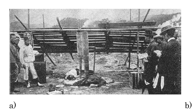
Fig.22a This photo shows heavily devastated Otsuchi town, Iwate Prefecture, in June 1986. Fig.22b The same location as Fig.22a in May 2017.

図 22a 1896 年 6 月, 岩手県大槌町の惨状 図 22b 2017 年 5 月現在の同一地点