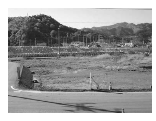
図 22a 1896 年 6 月, 高橋信三郎が撮影した岩手県大槌町の惨状(宮内庁書陵部蔵) 図 22b 2017 年 5 月現在の同一地点

Fig.22a This photo, taken by Shinzaburo Takahashi, shows heavily devastated Otsuchi town, Iwate Prefecture, in June 1986 (the Imperial Household Archives Collection). Fig.22b The same location as Fig.22a in May 2017.