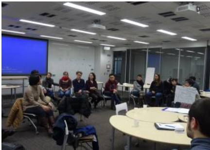
全体発表・討論の様子

ヤ人は果たして比較研究できるだろうかという問題意識をもってこのセッションに加わった。たしかに、前者は日本の植民地支配の犠牲者、後者はナチによる迫害とホロコーストの犠牲者であり、両者を安易に比較できないことは明らかだ。だが彼らが日本とドイツに留まることは「加害者の国」に生きることを意味した。その意味で、いずれもホスト社会における定住外国人や移民の問題一般に還元できない歴史的な存在である。以下では、セッションの準備と議論を通して得た気づきから、両者のアイデンティティの問題について考えてみたい。