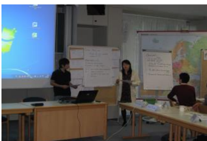
プレゼンテーションの様子

一方、ヨーロッパの政治で興味深かったものは、欧州連合が地政学に基づいた戦略的な政策を展開している点であった。特に、欧州近隣政策(ENP)や東方パートナーシップ、ロシアやトルコとの関係にみられる戦略的な政策は、ヨーロッパ周辺の中東諸国、北アフリカを巻き込んだ地域における、過去から続く国家間関係が深く関わっている。このように、直接的に欧州連合へと統合しない場合にも近隣諸国との関わりを深めていることがわかる。これらの国々には過去の歴史的な問題(侵略行為や虐殺事件の認知など含めて)を抱えている国もあるが、経済連携によって互いに未来志向型の協調関係を築いている姿は、東アジアではそこまで育っていないように感じるため印象的であった。