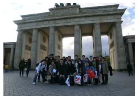
ブランデンブルク門(ベルリン)

Overhaus, Marco, "Violence and Post-conflict Transitions—Twin Challenge for the EU in the Arab Spring", SWP Comments , Dec, 2011.