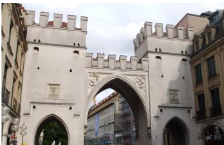
カールス門(ミュンヘン)

授業は一日に3コマから4コマであり、週に16コマで、1コマ80分であった。授業形式はいくつかの種類に分かれており、説明の容易化のために以下では個別にその授業内容と成果、反省について述べていく形式で記す。