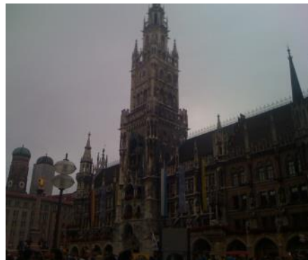
新市庁舎(ミュンヘン)

も他の生徒との会話を通して、互いに平易な文法を使った会話でも互いの意図が通じ合わせることができるといことはドイツ語力の自信にもつながったように感じられる。実際にコミュニケーションを取るにあたって最も必要なのは文法ではなく伝えようとする意識なのであると考えさせられた。コミュニケーションとは絶対的に合格点のあるものではなく、拙い語彙や文法でも言葉を尽くすことによってその相手からの理解レベルは必ず上昇するものであることに気付かされた。