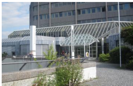
コブレンツ・連邦文書館

文のテーマに関係する可能性がある事例の調査報告を行い、これまで二次文献から得た知識を参考にして、史料調査によって多少決まった方向性にふれ、今後の展望を考察することで成果報告とした。1章では、主に渡航前までの関心に沿って行った二次文献調査の内容をまとめ、2章では、具体的に閲覧した史料の内容を報告する。最後に、まとめと考察として、現段階でしぼられた自分の関心および修士論文のテーマの方向性について述べたい。