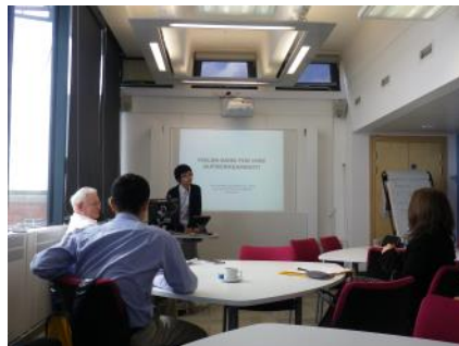
プレゼンテーションの様子

いドイツ以外の国に関することがおそろしくなりがちであり、日本と英国の学術界における慣行の違いを楽しむことができたよい機会であった。特に興味深く聞いた話は、博士課程の学生生活はワーカホリックであるということである。研究では厳しい競争にさらされ、授業も行う。会議の運営もしなければならず、休日でもメール対応などをしなければならない。ゆえにワーカホリックであるとのことだ。筆者の周りを見てみると、特に人文系では、場合によってワーカホリックからは程遠くのんびりした研究生活を送る人もいる。たとえ忙しいと言っても、研究者生活としてのワーカホリックというよりは、学費や生活費の捻出など、他のことで忙しいということが多く見られるだろう。博士課程一年目の筆者は、いまだ修士からの延長という気分ではいたが、ワーカホリックとまではいなくても、研究や授業、それに付随する仕事に打込まなければと改めて考えるよい機会だった。