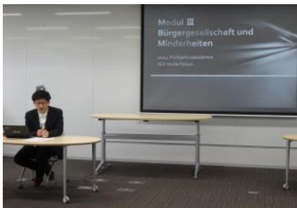
学生セッション「市民社会とマイノリティ」の導入

今回のアカデミーならびに学生セッションのテーマは「市民社会とマイノリティ Bürgergesellschaft und Minderheiten」であったが、このテーマに関してアカデミーの参加学生の一人という立場から我々がどのようにセッションを組むことができるのか、当初は見当をつけるのが容易ではなかった。そもそもIGKの共通テーマである市民社会についても通時的共時的な学問的蓄積がすでにIGK内外で蓄積されているし、他方マイノリティ研究も昨今盛んに展開されている。その中で必ずしも両者のテーマに通じているわけではない博士課程の学生が主体となり、何を生み出すことができるのかについて、我々(少なくとも私)は多少ならぬ悩み、PT内部でも様々な議論があった。