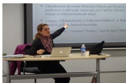
モジュールⅡ: 講義の様子