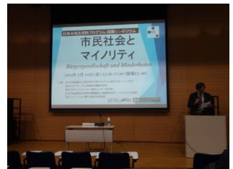
シンポジウム「市民社会とマイノリティ」