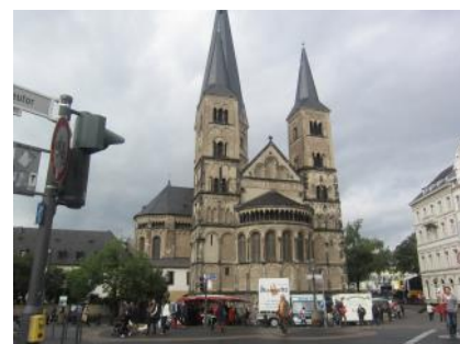
ボンのミュンスター教会

そのような背景を踏まえ、1972年連邦議会選挙では東方政策が争点になり、芸術、学問やスポーツ界の著名人がSPD支持を表明した。4月には、マルクス主義から保守主義にいたる著名な歴史家や政治学者が、歴史家ハンス・モムゼンが起草した声明において、社民自民連立政権の東方政策に支持を表明した。200名の署名者の中には、カール・ディートリヒ・ブラッハー、フリッツ・フィッシャー、ラインハルト・コゼレック、ゴロー・マン、トーマス・ニッパダイといった著名な歴史家が含まれる 11 。