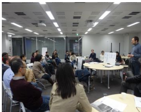
グループ発表の様子

このように書くと、一見在独ユダヤ人のアイデンティティ形成は成功し、在日コリアンのそれは失敗したと見えるかもしれないが、決してそうではない。今なお両者とも若い世代も含めてアイデンティティの葛藤を抱えている。ここには日独のマジョリティ社会が向ける彼らへの眼差しが作用しているのだ。