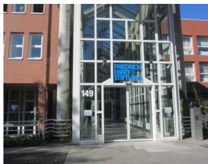
ボンのフリードリヒ・エーベルト財団

コンクールの際の歴史研究に必要な史料収集にあたって、理事会は、例えばコブレンツの連邦文書館のような該当する史料が所蔵されている機関に、コンクールの際の生徒の調査への協力を依頼している。そして、このコンクールには、歴史家も関わっている。例えば、当時ドイツ歴史家連盟(Der Verband der Historiker Deutschlands)の議長を務めていた歴史家ヴェルナー・コンツェは、依頼されて役員として理事会に参加し、テーマの選定に関与している。また、1973年夏に歴史家や教育学者が、専門家会議に招かれた。そして、テーマについて会議がなされた。