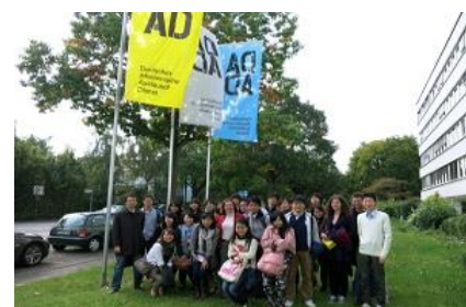
ドイツ学術交流会 (DAAD) 訪問 (ボン)

Departure of the Participants of the European Fall Academy 2013