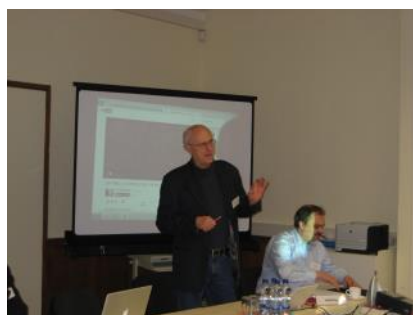
マンフレート・ヘットリング教授

セミナー二日目・三日目はマンフレート・ヘットリング教授(ハレ大学)とティノ・シェルツ氏(ハレ大学)の企画によるワークショップ「市民社会とドイツと東アジアにおける政治的な死者崇拜(politischer Totenkult)」が開催された。