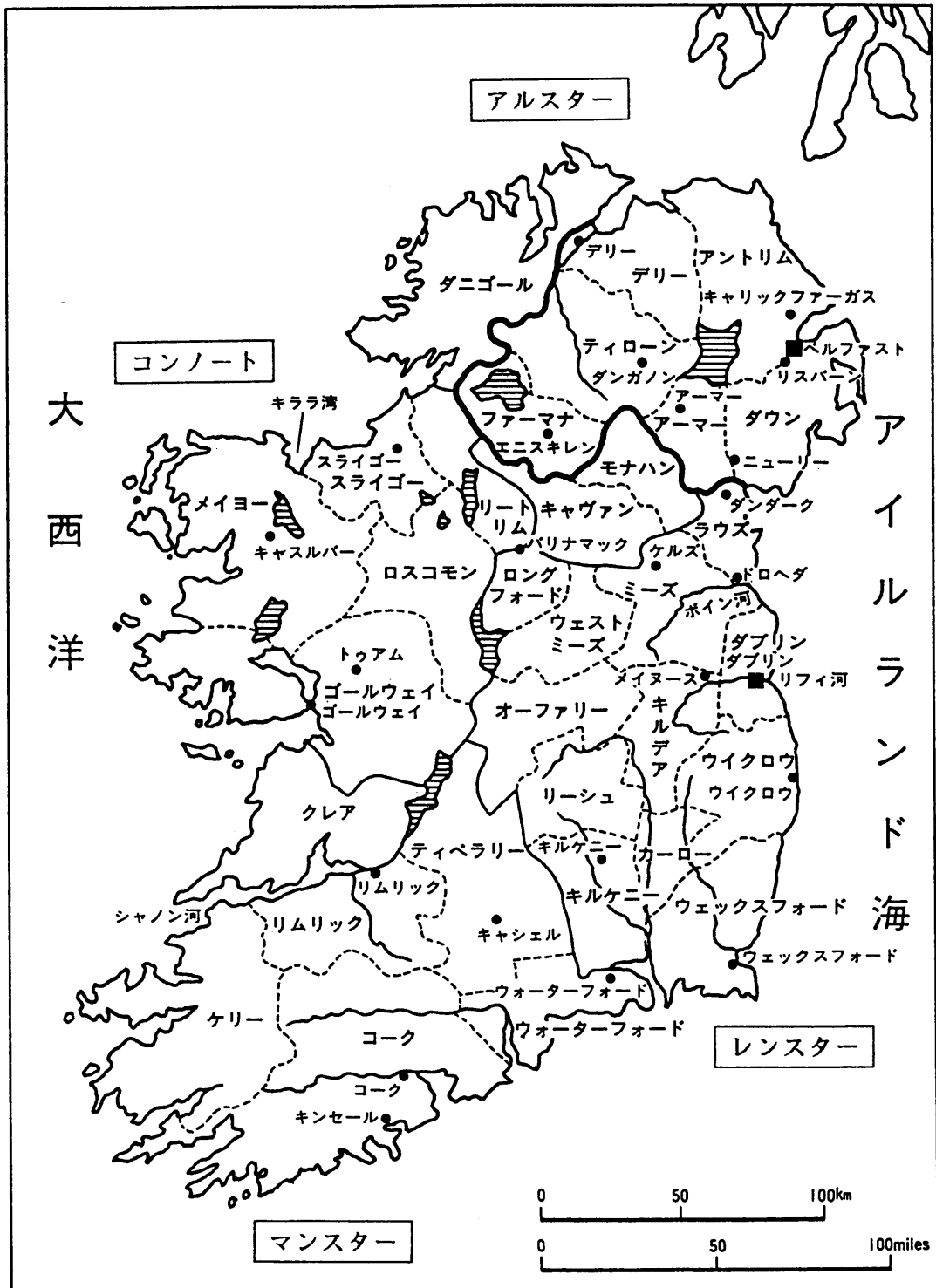
<図1> アイルランドの地方及び県（カウンティ）<北アイルランドを含む>

(注) 実線は地方界、破線は県界であり、アルスター地方内太線部分が北アイルランド。