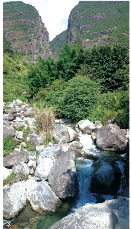
①設景協議の様子 ②清流の水源 ③石門関と清流 ④豊富な石材と清流 ⑤石門関