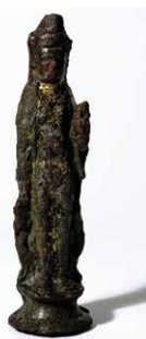
銅造観世音菩薩立像

犬田神社前遺跡では鎌倉時代～安土桃山時代(中世)にかけての痕跡も見つかっています。出土した銅造観世音菩薩立像は手のひらに収まる大きさで、館でおまいりしたり身辺に置いたりするものでした。