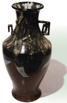
しざんやき 紫山焼