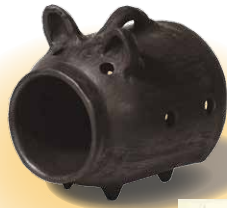
げんぼうじやき 源法寺焼の蚊やり豚