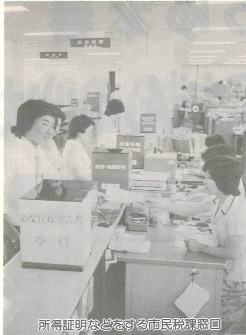
所得証明などをする市県民税課窓口

市県民税を納めていただく人は原則として次の方々です。 ▽53年1月1日現在大分市に住