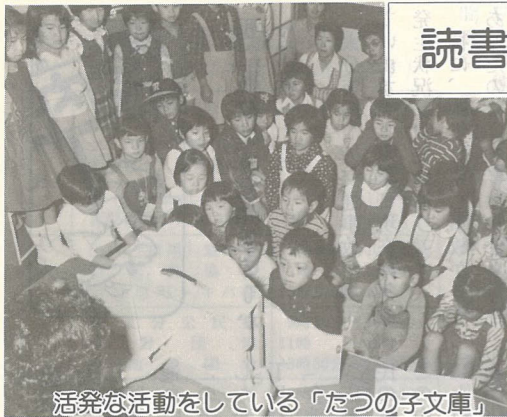
活発な活動をしている「たつの子文庫」