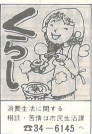
消費生活に関する相談・苦情は市民生活課 ☎34-6145へ

油脂類は、カロリーが高く、カロリー源として貴重なものです。 特に植物性の油は、血中のコレステロールの減少をはかり、さらに血管へのコレステロール沈着を防止する働きをもっています。 しかし、油は空気、光、熱などによって酸敗し、食中毒の原因にもなりかねませんので購入時、使用時に注意が必要です。 買う時は、回転の早い店で、日光のあたらない温度の低い場所におかれているなど店頭管理のゆきといた店を選びます。 食用油の容器には、缶、ビン、プラスチックがありますが、プラスチック容器の場合には塩ビモノマーの溶出などの不安がありますので、なるべく製造月日の新しいものを選びましょう。 また、目玉商品の場合は、特