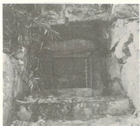
長持形石棺で、長さ2・3m、高さ40cm、両側に2カ所板状に突起した作りであり、石室と石棺が完備している古墳は県内に2カ所しかない。墓制史上非常に貴重なものである。(県指定昭和30年5月28日)

丑殿古墳は、横穴式石室墳で墓門は東南に面していたと推定される。奥行きは6・8m、玄室(遺体の安置室)の幅2・5m、高さ1・5m、全体として箱式の石室である。 石棺は、加工板石を組合せた