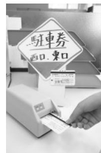
えきがるセンターのカウンタに設置されている駐車券認証機

駐車場入り口で選択した窓口（蘭東支所またはJR）で、駐車券の認証を受けてください。認証を受けた駐車券を駐車場出口のゲート昇降機に挿入すると、ゲートが開きます。