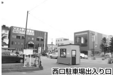
西口駐車場出入り口