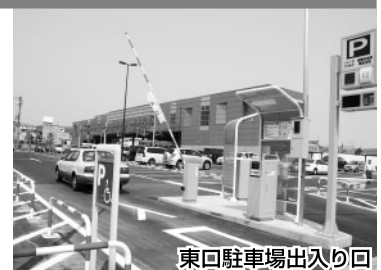
東口駐車場出入り口