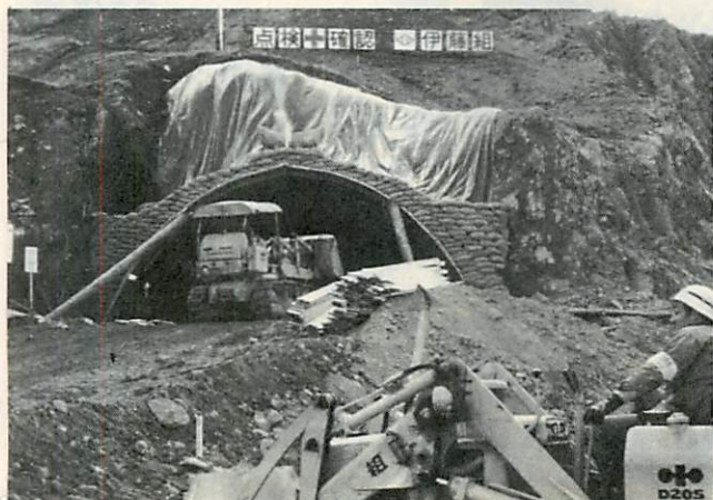
◀ 工事ははじめられた東室蘭トンネル

補正予算は、一般会計、南北台地開発特別会計、下水道事業特別会計、水道事業会計の公共事業について、本年度の補助起債など特定財源を充当して、二億六千三百万円と明年度の財源を予定した債務負担行為で一億一千三百五十万円の合計三億七千五百五十万円を補正したものです。また、中小企業対策として、一千万円を原資とする中小企業振興資金特別融資貸付金も補正し、積極的な景気浮揚を図ることになりました。