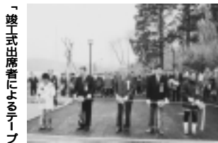
「竣工式出席者によるテープカット」

97年3月から整備を進めていた野津田公園の第2期区域整備が一部完了し、3月18日に竣工式を行いました。野津田公園は、市民が日常生活圏の快適な自然環境の中で、誰でも身近にスポーツ・レクリエーションを楽しめる