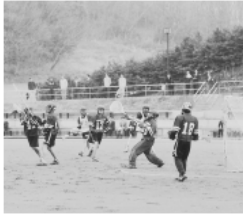
「国土館大学ラグロ部によるラグロス紹介試合」

97年3月から整備を進めていた野津田公園の第2期区域整備が一部完了し、3月18日に竣工式を行いました。野津田公園は、市民が日常生活圏の快適な自然環境の中で、誰でも身近にスポーツ・レクリエーションを楽しめる