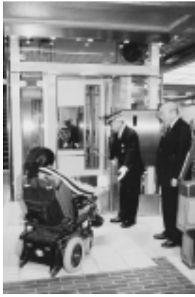
「新設されたエレベーター」

公園東側の第2期区域の一部で、東取付道路、東駐車場上の原広場、トイレ・更衣室棟などが竣工。中でも上の原広場にはタフト舗装を施し、112人収容のスタンドベンチを設置。より運動場として使いやすくなりました。また、雑木林やスキ草地なども維持し、谷戸山の自然環境を重視した自然の中で、今まで以上に楽しむことができる公園となっています。