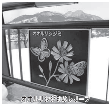
オオルリシジミのレリーフ

このように、橋を渡りながら、地域の自然や橋の歴史を楽しめます。中央橋は、技術的に優れ、豪華で美しく、そして、心を和ませてくれます。まさに飯山市の宝です。私たちが大切に末永く使って、子や孫に継承すべき素晴らしい現代土木遺産なのです。