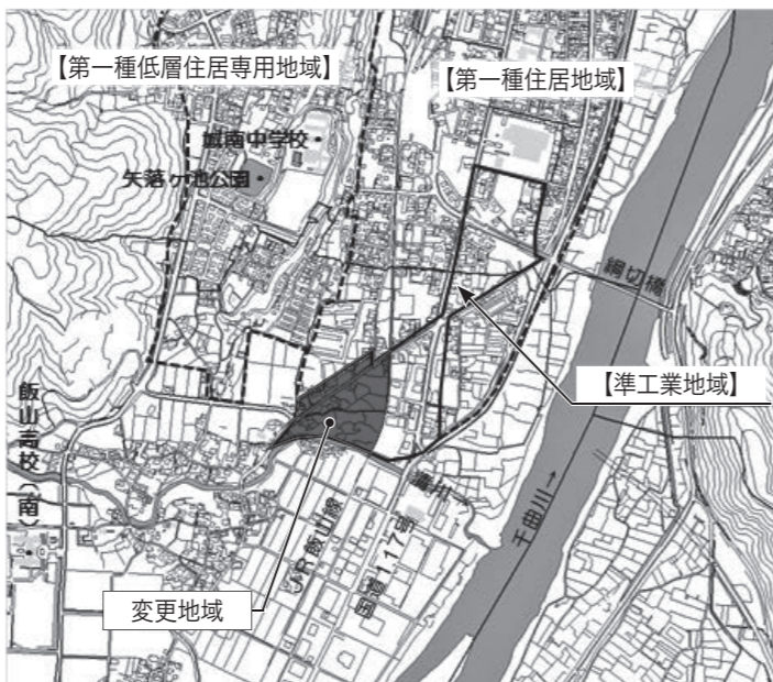
【変更内容】準工業地域→第一種住居地域(約3.7ヘクタール)

市では、今年度中に飯山都市計画区域の用途地域について、次のように変更を計画しています。都市計画法に基づき、素案概要の閲覧を行うとともに計画(素案)についてご意見等がある方については、公述人の受付を同様に行います。