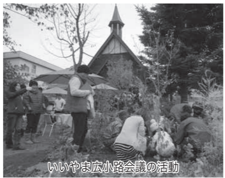
いいやま広小路会議の活動

飯山駅は、信州の北の玄関口にあたり、信越自然郷観光のハブ駅となりますので駅から周辺観光地への二次交通が重要となります。8月に長電