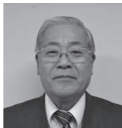
服部館長は長野工業高等専門学校で橋工学の教鞭を執られていました。