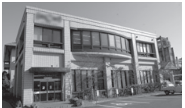
東近江スマイルネット放送局舎(池庄町)

スマイルネットには、一定の地域に一齐に放送をしたり、安心安全な生活に利用できる『音声告知放送』があります。