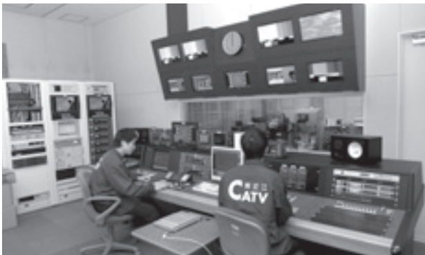
地上デジタル放送にも対応した調整室

放送日は月曜日から金曜日 で、一部の時間帯を除いて「こ んにちは市役所です」に続い て放送します。