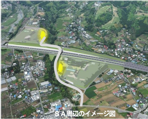
SA周辺のイメージ図

市内では、平成32年度中を開通目標に新東名高速道路の整備が進められており、秦野インターチェンジ(仮称)と秦野サービスエリア(仮称)が整備されます。また、現東名高速道路とのダブルネットワーク化により広域での交通利便性が飛躍的に向上することから、産業集積のポテンシャルが高まり、企業の成長や競争力を高める効果が期待されます。