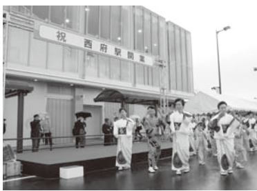
▲市内14番目の駅を開業

武蔵国府跡御殿地区が国史跡に追加指定／東日本大震災の影響を受けた事業者を対象とした無利子の「震災緊急対策資金」新設／ふるさと府中歴史館開設／府中駅南口第一地区市街地再開発組合設立／暴力団排除条例制定／全市立小・中学校と幼稚園の普通教室に冷房設備設置／姉妹都市長野県佐久穂町とカーボンオフセット事業の協定締結／事業仕分けの手法による事務事業点検実施／女子サッカー選手の澤 穂希氏に府中市初の市民栄誉賞贈呈／郷土の森観光物産館開設／「防災ハンドブック」全戸配布