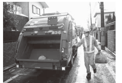
▲効果的なごみ減量施策を展開

家庭ごみの有料化・戸別収集開始／水防・防災ステーション開設／人口が25万人突破／府中消防署との合築による中央防災センター開設／けやき並木通りの日曜日・祝日の車両交通規制開始