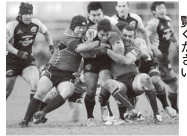
▲迫力あるプレーをご覧ください