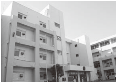
▲耐震化による教育環境の整備

町2・3丁目の一部)が国史跡に指定／小・中学生医療費無料化／けやき並木通りが都から市に移管