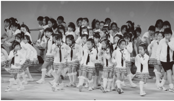
▲元気いっぱいのステージをご覧ください

▽会場 府中の森芸術劇場 ▽入場 自由(無料) ▽問合せ 是政文化センター(365・6211)