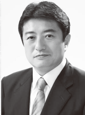
府中市長 高野律雄