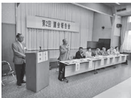
福祉女性会館の様子

なお、各会場における実施報告書につきましては、秩父市議会のホームページから閲覧していただくか、議会事務局までお問い合わせください。