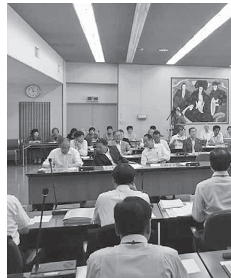
6月定例会本会議の様子

東日本大震災の復興財源を確保するため、国では24年度と25年度の2年間、国家公務員の給与を減額しているほか、25年