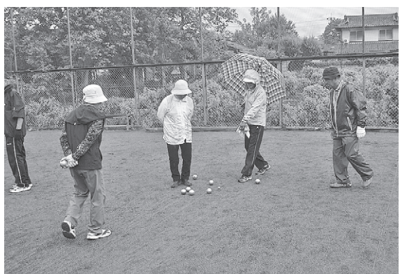
チャレンジデーの実施内容

答 イベントを実施するにあたり多くの町会より協力員を選出して頂き、地域住民の参加とりまとめをしていただいた。市内の学校、企業、行政施設並びに福祉施設等にも参加を呼びかけ、協力いただいた。