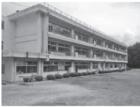
耐震補強の改造工事が決まった荒川中学校校舎