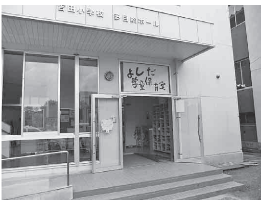
多目的ホールに同居している吉田学童保育室

答 地元住民が安心できる土地利用について、提案された公共工事残土の処分場とすることについても関係部局と検討したい。