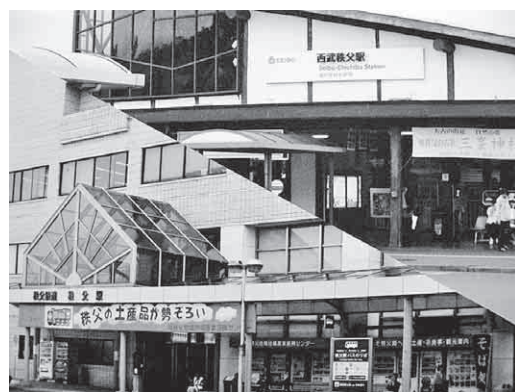
どちらも大切な交通網

答 市長の任期は1期4年間が一つの区切りとなっている。他の条件も全て4年が区切りで処理されている。条例を変更しないと寄付行為が発生し失職の事態が発生することも考えられる。そこで一旦