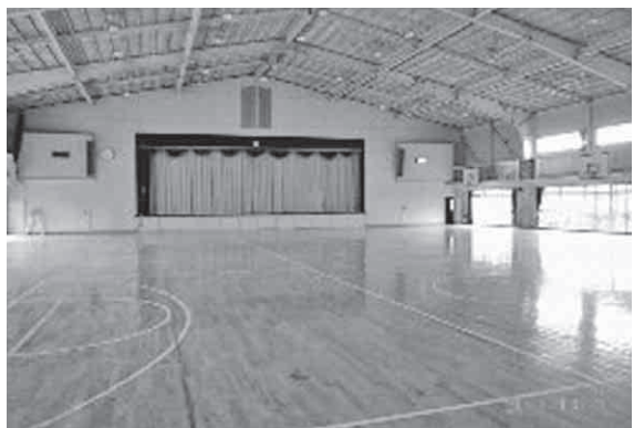
旧東高体育館の活用を

答 秩父市の非正規職員の割合は44・4%で、県内市の内最大。この内、保育職場は58・8%、教育職場は73・8%である。