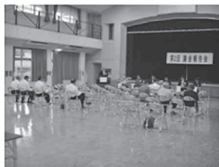
荒川農村環境改善センターの様子