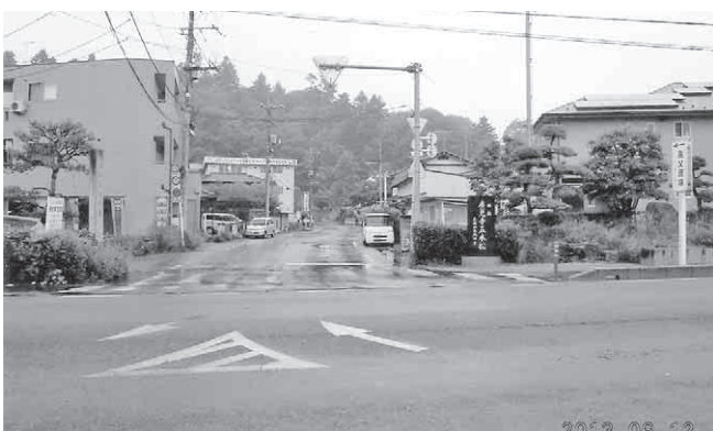
拡幅予定の火葬場への道路

る平地の確保ができず、高低差のある土地の造成等が不可欠となることから、市としては、馬場の移転・新築にかかる費用は秩父広域市町村圏組合の火葬場移転補償で対応することを基本にしており、建設費の面からも断念せざるを得ない状況で、羊山公園への移転を今後も連盟の皆さんに説明し、ご理解いただく所存である。