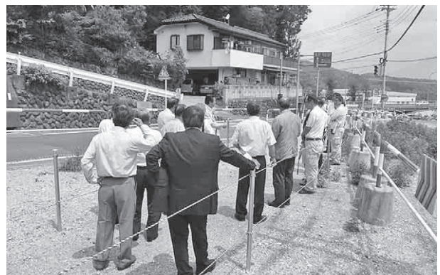
別所71号線・水道工事の現地調査の様子