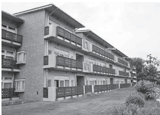
ほのほのマイタウン

答 特別養護老人ホームは、市内に5施設360床整備されており、待機者は現在381人である。他の施設は、グループホーム5施設72床待機者42人、他に介護老人保健施設、有料老人ホーム、経費老