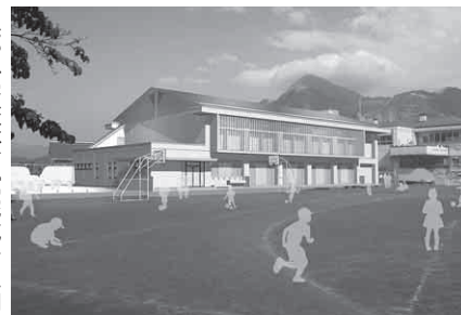
久那小学校体育館完成予想図