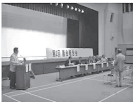
吉田やまなみ会館の様子