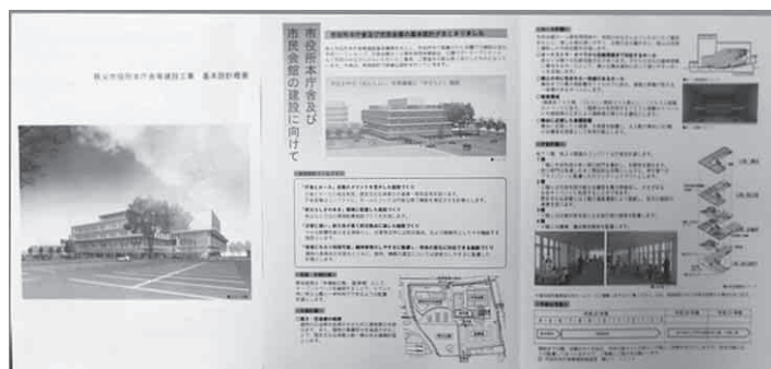
市役所本庁舎等建設工事 基本設計概要

答 秩父市役所本庁舎等基本設計では、新庁舎及び市民会館の本体構造は免震構造ではなく耐震構造であり、災害拠点施設となるため耐震構造のランクをI類とし、建設基準法で定めている一般建物の1.5倍の強度を