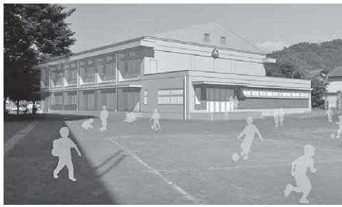
影森小学校体育館完成予想図