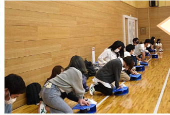
救急救命法講習会