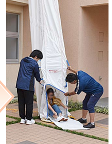
防災避難訓練 4階からの脱出