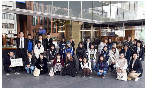
遠足(R3年度) 山梨ジュエリーミュージアムにて