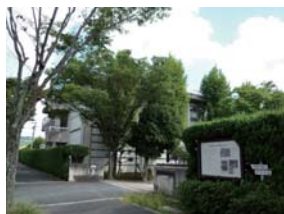
高槻市埋蔵文化財調査センター