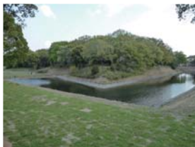
史跡今城塚古墳 (上: 整備前 下: 整備後)