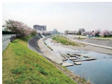
桜堤公園全景と桜