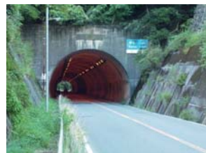
分水嶺の檜田トンネル

芥川最上流部は 明神ヶ岳 付近を水源とする 田能川 とその南東の 小塩山 付近を水源とする 出灰(いずりは)川 の2つの支流に分かれる。高槻市最北部の田能川流域の檜田地区は、四周を山に囲まれながら少し開けて水田の見られる山里の景観