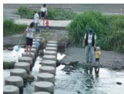
桜堤公園の飛び石風景