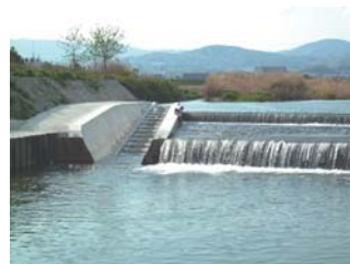
芥川大橋上流に新設された魚道