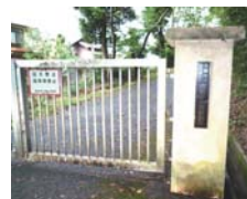
京都大学阿武山地震観測所入口