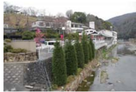
温泉旅館と塚脇橋上流