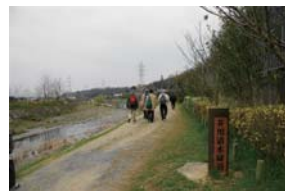
遊歩道 (芥川清水緑道)