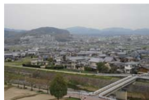
対岸に迫る高槻市の住宅地