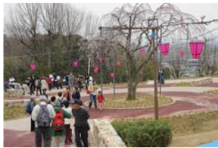
桜広場と枝垂れ桜

摂津峡の下流側入口(「下の口」バス停・塚脇橋)付近は、服部の地名から推測されるように古代の渡来系機織り部の里であったと言われる。右岸側の河岸段丘上の新興住宅街の南平台(かつてはゴルフ場)や桧尾川との間の古曽部台などでは、箱形埴輪や武人形埴輪が出土する古墳群が散在し、出土品は現在、南平台小学校近くの 高槻市埋蔵文化財調査センター に保管されている。