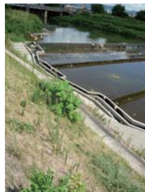
桜堤公園下流の落差工の魚道