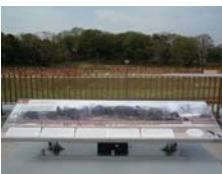
史跡内のはにわ公園