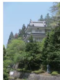
城の櫓風のゴルフ場入口