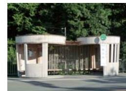
原立石バス停(桶風のバス待合室)