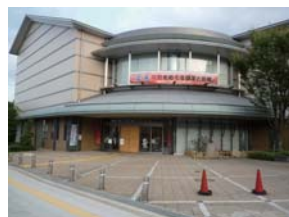
高槻市立歴史民族資料館