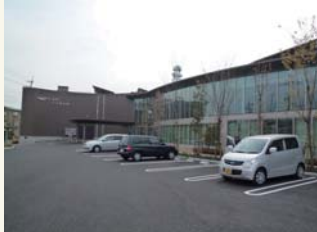
【今城塚古代歴史館】

現在は周囲が柵で囲まれ、水と緑が輝く史跡公園(いましろ大王の杜)として整備が済み、はにわ公園や遊歩道等が整備されて、この2011年4月に新装デビューした。その北隣に古代体感ミュージアム「今城塚古代歴史館」も併せて開設され、駐車場など周辺の整備が進んで、来場者を待っている状況にある。