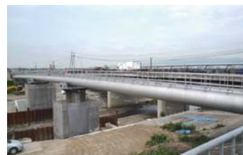
芥川を跨ぐ府営水道水管橋

域を流れ、 芥川大橋 のすぐ上流で 如是川 を合流し、 次郎四郎橋 や環境基準点の 鷺打橋 を流下して、淀川に注ぐことになる。最近、このすぐ上流側でも魚道設置の堰の改修工事が行われた。