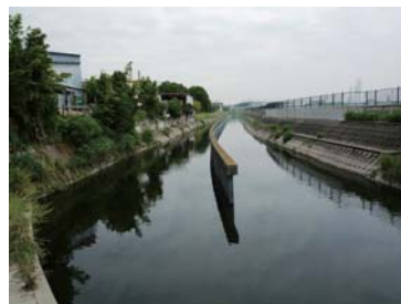
逆流遡上防止用の背割矢板のある番田井路