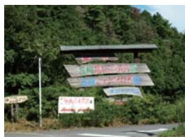
閉園されても残された高槻花しょうぶ園としゃくなげ園の看板