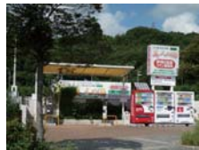
温泉水販売スタンド