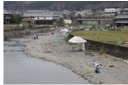
河川内の有料魚釣り場