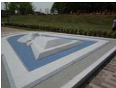
コンクリート製模型