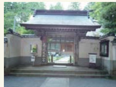
〔左上：神峰山寺と右下：本山寺〕