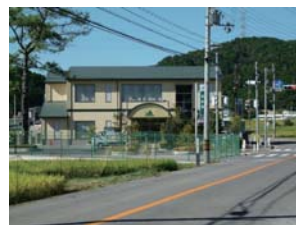
檜田校前のJA農風館