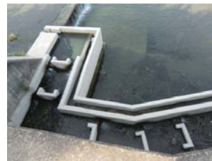
あくあびあ芥川付近の魚道

摂津峡下流側入口の塚脇橋から下流側約2kmの河岸段丘下の河川沿いには、途中に小さな公園もある遊歩道が整備され、のどかな水田風景の向こうに高槻市の住宅街が遠望できる。この流下区間は6月にはゲンジボタルやヘイケボタルが乱舞する清流が残されている。遊歩道下流端近くの河川沿いの斜面に、 あくあびあ芥川(芥川緑地資料館) が存在する。あくあびあ芥川は、高槻市教育委員会が運営する入場無料の資料館で、多種多様な水生生物や高槻市内の動植物の展示があり、学芸員の指導による小学生の環境学習の場になっている。あくあびあ芥川の隣(下側の芥川沿い)には 高槻市立芥川緑地プール(ぷーるぴあ) があり、夏期休暇中にちびっ子の水遊びに利用される。このあくあびあ芥川の上側の入口には、JR高槻駅に向かう「南平台小学校前」バス停がある。