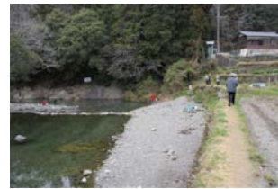
魚釣り場に沿う遊歩道