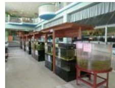
あくあびあ芥川館内展示