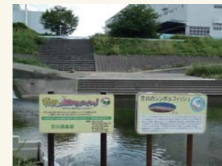
【川づくり活動の表示】

「こいのぼりフェスタ1000」や魚の遡上できる魚道「魚みちづくり」が特筆される活動であろう。「芥川倶楽部」の名の機関誌や「芥川水辺だより」を発行している。2008年にネットワークの充実化を目指し、「NPO法人芥川倶楽部」として発足して、現在に至り、継続して活発な市民活動を展開している。