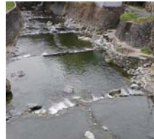
瀬の部分の魚釣り場