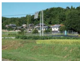
檜田地区民家と田園風景