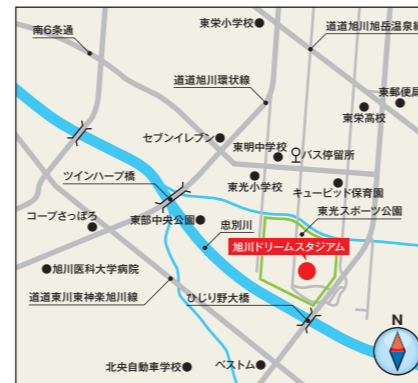
【旭川ドリームスタジアム】旭川市東光25-26条8丁目

※交通機関の情報は変更になる場合がございますので、各バス会社に最新の情報をご確認ください。