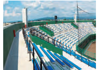
メインスタンド(観覧席)