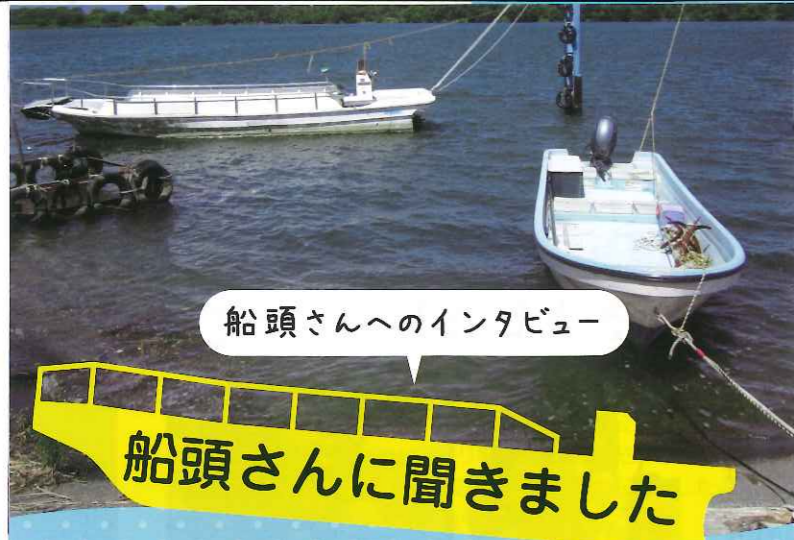
船頭さんへのインタビュー

濃尾大橋の交通量の増大に伴い、濃尾大橋南側(渡船場から約1km上流)に新しい橋を建設する予定となっており、現在建設中。完成後、渡船場は廃止となる予定です。